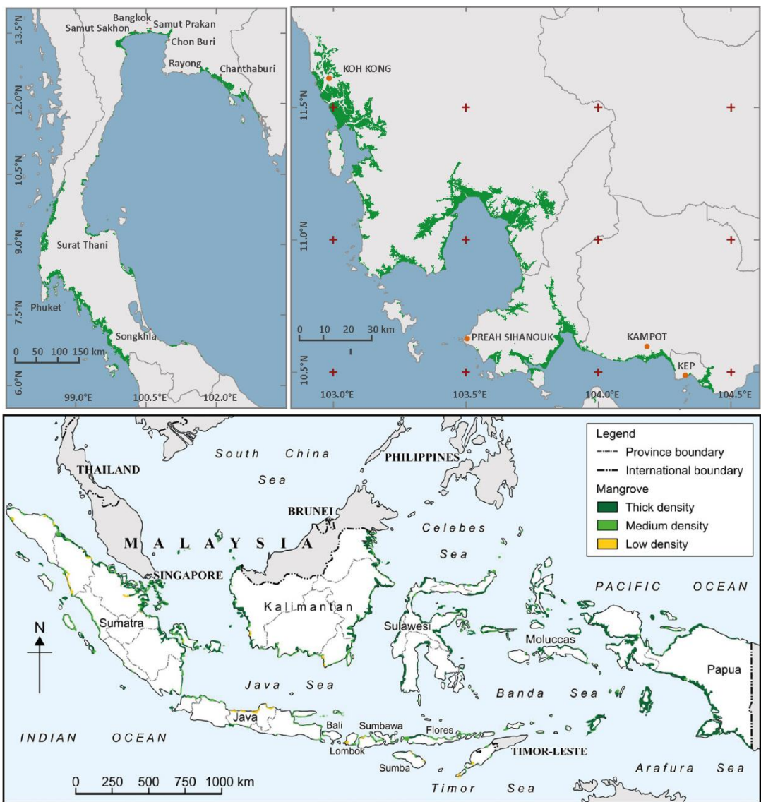
រូបភាពទី ១៖ របាយភូមិសាស្ត្រនៃព្រៃកោងកាងក្នុងប្រទេសកម្ពុជា ថៃ និងឥណ្ឌូនេស៊ី [៥,១១]

តំបន់អាស៊ីអាគ្នេយ៍ មានព្រៃកោងកាងសរុបប្រមាណ៣៣%នៃគម្របព្រៃកោងកាងនៅលើពិភពលោក។ យោងតាម ទិន្នន័យរបស់អង្គការឃ្លាំមើលព្រៃកោងកាងសកល ក្នុងឆ្នាំ២០២០ប្រទេសឥណ្ឌូនេស៊ី ជាប្រទេសនាំមុខគេ ដែលមានគម្រប ព្រៃកោងកាងច្រើនបំផុត ខណៈប្រទេសថៃ និងកម្ពុជា ជាប់ចំណាត់ថ្នាក់ទី៥ និងទី៧រៀងគ្នានៅក្នុងតំបន់ [១,៥]។