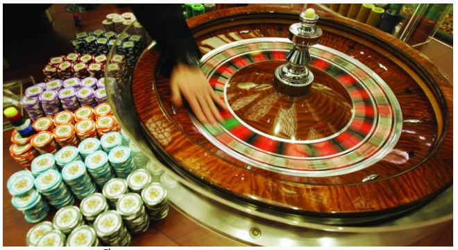
ដោយ ខេមបូឌូមីស

ប្រភព៖ ខេមបូឌូមីស ចេញផ្សាយថ្ងៃទី១១ ខែមីនា ឆ្នាំ២០២២។ កម្ពុជា រំពឹងរកបានចំណូល៣៥លានដុល្លារពី វិស័យ បន់ល្បែង នៅឆ្នាំ២០២២នេះ