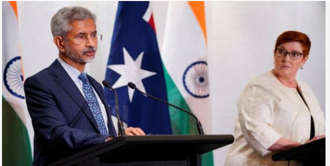
ដោយ ខេមបូឌូមីស

ឥណ្ឌាផលិតស្រូវសាលីប្រហែល ១០៨ លានតោនក្នុងមួយឆ្នាំ ដែលសឹងតែស្មើ ១៤%នៃទិន្នផលសរុបនៅក្រៅប្រទេស ប៉ុន្តែភាគច្រើននៃស្រូវសាលីទាំងនេះត្រូវបានប្រើប្រាស់តែក្នុងស្រុកប៉ុណ្ណោះ។ ដោយ ម៉ែន ខែមរៈ ប្រភព៖ rasmeinews ចេញផ្សាយថ្ងៃទី០៩ ខែមីនា ឆ្នាំ២០២២។ អូស្ត្រាលី និងឥណ្ឌាកំពុងឆ្ពោះទៅរកកិច្ចព្រមព្រៀងពាណិជ្ជកម្មសេរី ដើម្បីកាត់បន្ថយការពឹងផ្អែកលើចិន