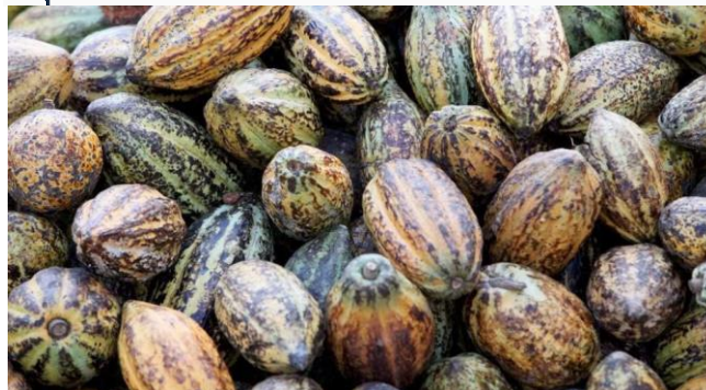
ដោយ ខេមបូឌូមីស

ទោះបី កាកាវដាំដំណាំថ្មីសម្រាប់កម្ពុជា តែបច្ចុប្បន្នគេសង្កេតឃើញថាប្រជាកសិករ ពេញនិយមដាំដំណាំមួយនេះស្ទើរគ្រប់ខេត្ត ព្រោះមានទីផ្សារខ្ពស់ពិសេសនៅទីផ្សារតំបន់អឺរ៉ុប តែម្តង។ បច្ចុប្បន្ន គ្រាប់កាកាវ ១តោន មានតម្លៃរហូតដល់ ២ពាន់ដុល្លារ។