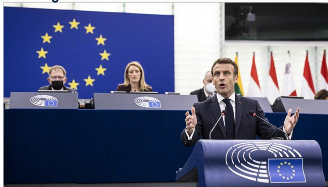
ដោយ ខេមបូឌូធីស

ប្រភព ៖ freshnews ចេញផ្សាយថ្ងៃទី១០ ខែមីនា ឆ្នាំ២០២២។ បារាំងចង់ឱ្យសហភាពអឺរ៉ុបកំណត់កញ្ចប់បំណុលថ្មី ចំពោះសង្គ្រាមនៅអ៊ុយក្រែនតាំងខ្លាំង