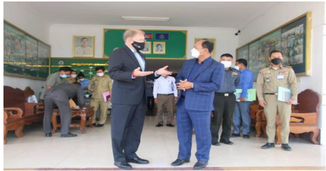
ដោយ ៖ Kampucheamey

ប្រភព៖ ភ្នំពេញប៉ុស្តិ៍ ចេញផ្សាយថ្ងៃទី ៨ ខែកុម្ភៈ ឆ្នាំ២០២២ អភិបាលខេត្តបន្ទាយមានជ័យ បង្ហាញពីសក្តានុពល សេដ្ឋកិច្ច និងវិនិយោគដល់ទួតអាមេរិក