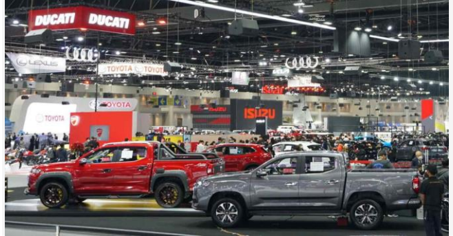
ដោយ ខេមបូណូមីស

ការលក់រថយន្តថ្មីនៅក្នុងប្រទេសឥណ្ឌូនេស៊ី ថៃ ម៉ាឡេស៊ី វៀតណាម ហ្វីលីពីន និងសិង្ហបុរីមានចំនួនសរុបជិត ៣ លានគ្រឿងកាលពីឆ្នាំ២០២១ កើនឡើង ១៤% បើធៀបនឹងឆ្នាំ ២០២០។