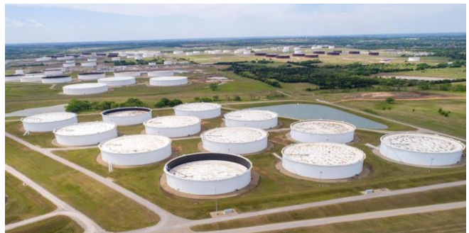
ធុងស្តុកប្រេងនៅត្រូវបានគេកេរយើងនៅក្នុងរូបថតពីលើអាកាសនៅមជ្ឈមណ្ឌលប្រេង Cushing ភ្នំទីក្រុង Cushing រដ្ឋ Oklahoma នៅសហរដ្ឋអាមេរិក ថ្ងៃទី២១ ខែមេសា ឆ្នាំ២០២០

ប្រភព៖ Reuters បញ្ជីផ្សាយ ថ្ងៃទី០៥ ខែកុម្ភៈ ឆ្នាំ២០២២ កិច្ចចរចារវាងសហរដ្ឋអាមេរិក និងអ៊ីរ៉ង់លើកិច្ចព្រមព្រៀងនុយក្លេអ៊ែរ ទំនងជាអាចដកទណ្ឌកម្មលើការលក់ប្រេងនៅអ៊ីរ៉ង់ និងអាចបង្កើនការផ្គត់ផ្គង់ប្រេងនៅលើពិភពលោក