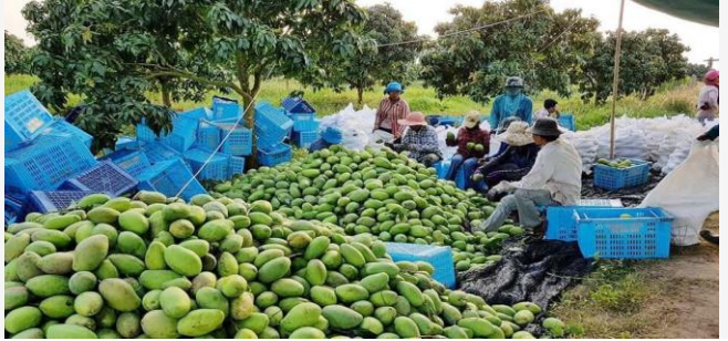
ដោយ ខេមបូធាម៊ីស(សកម្មភាពកសិករប្រមូលផលផ្លែស្វាយ)

ប្រភព៖ kampucheamey ចេញផ្សាយថ្ងៃទី០៨ ខែកុម្ភៈ ឆ្នាំ២០២២។ កសិករនៅតែប្រឈមការលំបាកច្រើនក្នុងការដាំដុះ ស្វាយឲ្យត្រូវតាមស្តង់ដារនាំចេញ ហេតុអ្វី?