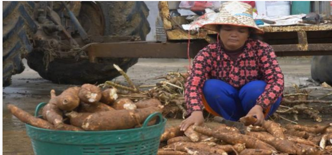
ដោយ ខេមបូឌូមីស

និងភូតតាមអនាម័យ ដើម្បីឆ្លើយតបទៅនឹងនិន្នាការរីកចម្រើនរបស់វិស័យកសិកម្ម ក្នុងក្របខ័ណ្ឌសុវត្ថិភាពស្បៀង ការលើកកម្ពស់គុណភាពផលិតផលកសិកម្ម ការបង្កើនការនាំចេញកសិផល និងធានាបរិភោគអភិវឌ្ឍន៍ ក្នុងបរិការណ៍សមាហរណកម្មសេដ្ឋកិច្ចពិភពលោក ប្រកបដោយការប្រកួតប្រជែង។ ដោយ ម៉ែន ខែមរៈ ប្រកាសខេមបូឌូមីស ចេញផ្សាយថ្ងៃទី០៥ ខែកុម្ភៈ ឆ្នាំ២០២២។ តម្លៃទីផ្សារដំឡូងមីមានការប្រែប្រួលយ៉ាងណាខ្លះ នៅដើមឆ្នាំ២០២២?