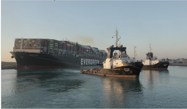
ដោយ ខេមបូឌូមីស (ការជាប់គាំងកប៉ាល់នៅក្នុងព្រែកដឹកស៊ុយអេ)

បើទោះបីជាក្នុងឆ្នាំ២០២១ ដំណើរការសេដ្ឋកិច្ចពិភព លោកហាក់មានសភាពយឺត តែវាជាដំណើរដែល សេដ្ឋ កិច្ចបានរួចផុតពីវិបត្តិ ដែលបណ្តាលមកពីកូវីដ ១៩។ នៅឆ្នាំ២០២២នេះ សេដ្ឋកិច្ចពិភពលោកត្រូវ បានរំពឹងថា នឹងមានកំណើនយឺតជាងឆ្នាំ២០២១ ពោលគឺនឹងមានត្រឹមតែជាង៤%ប៉ុណ្ណោះ ខណៈឆ្នាំ ២០២១មានដល់ទៅ ៥,៥% នេះបើតាមការព្យាករណ៍ ធនាគារពិភពលោក។ តើនៅឆ្នាំ២០២១ មាន ព្រឹត្តិការណ៍សេដ្ឋកិច្ចធំៗអ្វីខ្លះ បានកើតឡើង?