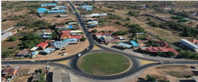
(ផ្លូវជាតិលេខ៧ ចំណុចរង្វង់មូលខ្លាស្នះ ក្រុងក្រចេះ)

កម្ពុជា មានប៉ូលសេដ្ឋកិច្ចចំនួន៣ បានចេញជារូបរាង មានដូចជា រាជធានីភ្នំពេញជាប៉ូលសេដ្ឋកិច្ចទី១, ខេត្ត ព្រះសីហនុ ជាប៉ូលសេដ្ឋកិច្ចទី២ និងខេត្តសៀមរាប ត្រូវបានកំណត់ជាប៉ូលសេដ្ឋកិច្ចទី៣។ រាជរដ្ឋាភិបាល កម្ពុជា មានចក្ខុវិស័យកំណត់យកតំបន់ប៉ែកឦសាន បង្កើតជាប៉ូលសេដ្ឋកិច្ចទី៤ របស់កម្ពុជា ក៏ព្រោះតែបាន សម្លឹងឃើញពីសក្តានុពលខ្ពស់នៃវិស័យកសិ-ឧស្សាហកម្ម និងធនធានរ៉ែ ក្នុងខេត្តមួយចំនួន នៅប៉ែកឦសាន នេះដូចជា ខេត្តក្រចេះ ស្ទឹងត្រែង រតនគិរី និង មណ្ឌលគិរី ជាដើម។