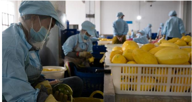
ដោយ ខេមបូឌូមីស

សេចក្តីព្រាងច្បាប់ស្តីពី «ការការពាររុក្ខជាតិ និងកូតតាម អនាម័យ» ត្រូវបានអនុម័តទាំងស្រុងរួចហើយ នៅក្នុង កិច្ចប្រជុំពេញអង្គគណៈរដ្ឋមន្ត្រីនាថ្ងៃទី៤ ខែកុម្ភៈឆ្នាំ ២០២២នេះ។ ខ្លឹមសារនៅក្នុងសេចក្តីព្រាងច្បាប់នេះ កំណត់អំពីការគ្រប់គ្រងសុខភាពរុក្ខជាតិ ការអនុវត្ត វិធានការការពាររុក្ខជាតិ និងវិធានការកូតតាមអនាម័យ ការពារធនធានរុក្ខជាតិគ្រប់ប្រភេទ ការទប់ស្កាត់ការ បង្ក ការរាលដាលឆ្លង និងការរាតត្បាតពីសំណាក់ សមាសភាពចង្រៃ ការលើកកម្ពស់ផលិតភាពកសិកម្ម សន្តិសុខស្បៀងអនាម័យគុណភាព និងសុវត្ថិភាព ផលិតផលកសិកម្ម។ សេចក្តីព្រាងច្បាប់នេះ ក៏នឹងជួយ សម្រួលដល់ការធ្វើពាណិជ្ជកម្មក្នុងវិស័យកសិកម្ម រួម ចំណែកក្នុងការអភិវឌ្ឍសេដ្ឋកិច្ចសង្គម។