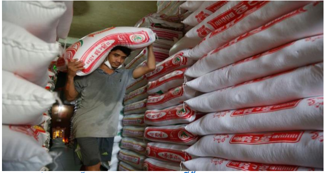
ប្រកាស ភ្នំពេញប៉ុស្តិ៍ ២០២២ រូបភាពរោង ដីនៃ