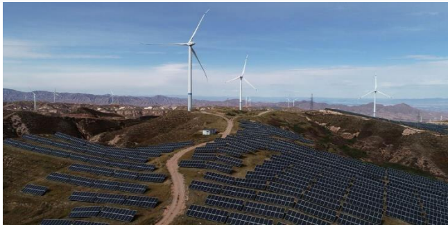
ដោយ ខេមបូឌូនីស

ចិនថា ការដំឡើងពន្ធរបស់អាមេរិកលើផលិតផលសូឡា ប៉ះពាល់ដល់ពាណិជ្ជកម្មវិស័យថាមពល