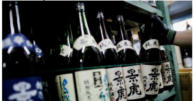
ដោយ ខេមបូឌូមីស

ប្រភព៖ ខេមបូឌូមីស ចេញផ្សាយថ្ងៃទី០៥ ខែកុម្ភៈ ឆ្នាំ២០២២។ ចិនក្លាយជាប្រទេសនាំចូលអាហារពីជប៉ុនធំបំផុតជា លើកដំបូងក្នុងតម្លៃជិត២ពាន់លានដុល្លារ