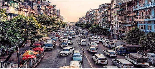
ដោយ ៖ dap-news

ប្រទេសសិង្កបុរីបានក្លាយទៅជាអ្នកវិនិយោគបរទេសច្រើនបំផុត របស់មីយ៉ាន់ម៉ាក្នុងរយៈពេល៤ខែចុងក្រោយ កាលពីឆ្នាំទៅគិតចាប់ពីខែតុលាមក។ មីយ៉ាន់ម៉ាអាចទាក់ទាញយកការវិនិយោគពីសិង្កបុរី ក្នុងទំហំទឹកប្រាក់ប្រមាណជា៥០៦លានដុល្លារ ដែលក្នុងនោះសេវាកម្មឯកជនមានទំហំ ប្រមាណជា២០៦លានដុល្លារ វិស័យផលិតកម្មប្រមាណជា១១៤លានដុល្លារ និងវិស័យសំណង់ប្រមាណ ជា៦៤លានដុល្លារ។ ក្នុងឆ្នាំសារពើពន្ធកាលពីឆ្នាំមុន មីយ៉ាន់ម៉ាអាចរកចំណូលបានរហូតទៅដល់ ៣ ៧០០លានដុល្លារ ពីបណ្តាក្រុមហ៊ុនឯកជនបរទេសទាំងឡាយ។ ដោយ ម៉ែន ខែមរៈ