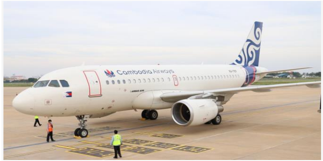
ដោយ ខេមបូឌូមីស(ព្រលានយន្តហោះអន្តរជាតិភ្នំពេញ)

វិស័យអាកាសចរណ៍របស់កម្ពុជា នៅមួយរយៈចុង ក្រោយនេះ ហាក់ងើបឡើងវិញគួរឱ្យកត់សម្គាល់ បន្ទាប់ ពីរាជរដ្ឋាភិបាលកម្ពុជា មានការបន្តបន្ថយការធ្វើចត្តា ឡីស័កសម្រាប់អ្នកដំណើរ។ បច្ចុប្បន្ន មានអ្នកដំណើរ ប្រមាណ ៧រយនាក់ ទៅ១ពាន់នាក់ ក្នុងមួយថ្ងៃ បាន ចូលមកប្រទេសកម្ពុជា។ អ្នកដំណើរទាំងនោះ រួមមាន ភ្ញៀវទេសចរ និងអ្នកវិនិយោគបរទេស រួមទាំងការធ្វើ ដំណើររបស់ពលរដ្ឋកម្ពុជា ផងដែរ។ បើទោះបីជា ចំនួន អ្នកដំណើរបរទេសចូលមកកម្ពុជាមានការកើនឡើងក៏ ពិតមែនប៉ុន្តែអ្នកជំនាញនៅតែបានម្តងដែរ ដោយសារ តែវីរុសបំប្លែងថ្មីប្រភេទអ្វីក្រុង កំពុងបន្តរីករាលដាល នៅឡើយ។