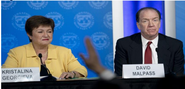
ដោយ ខេមបូឌីស្ថិតិ

ហោចណាស់១ដួស ខណៈប្រទេសចំណុះទាប និងមធ្យមវិញ មានប្រមាណតែ៩%ប៉ុណ្ណោះ ដែលបានចាក់វ៉ាក់សាំងបាន១ដួស។ ដោយ ម៉ែន ខែមរៈ ប្រកាសខេមបូឌីស្ថិតិវិទ្យាថ្ងៃទី១៣ ខែមករា ឆ្នាំ២០២២ ប្រធានធនាគារពិភពលោកប្រាប់ឱ្យប្រទេសចិន ជួយបន្ថែមបន្ថយបំណុលសម្រាប់ប្រទេសក្រីក្រ