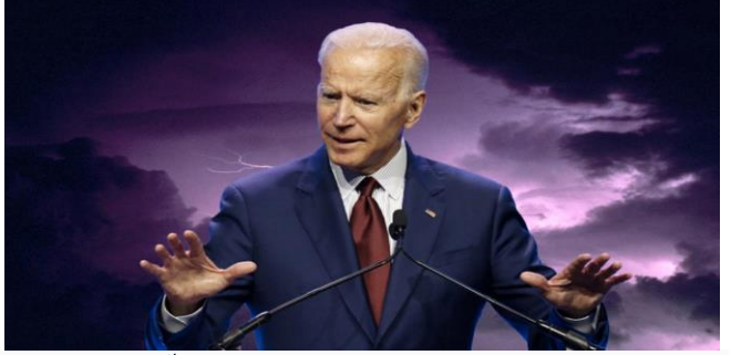
ដោយ ខេមបូឌូមីស

ប្រកបខេមបូឌូមីសចេញផ្សាយថ្ងៃទី១៨ ខែមករា ឆ្នាំ២០២២។ អតិផរណាអាមេរិក កើនខ្ពស់ដល់កម្រិតមិនធ្លាប់មាន ក្នុង ៤០ឆ្នាំចុងក្រោយនេះ