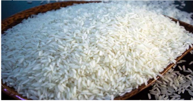
ដោយ ខេមបូឌូមីស(អង្ករបស់កម្ពុជា)

នៅក្នុងរយៈពេល១ឆ្នាំ ឆ្នាំ២០២១ កម្ពុជា បាននាំចេញ កសិផលទៅកាន់ ៦៨ប្រទេស ក្នុងបរិមាណជិត ៨លាន តោន បានកើនឡើងជាង ៦៣% បើប្រៀបនឹងឆ្នាំ ២០២០។ ប៉ុន្តែក្នុងនោះ ការនាំចេញអង្ករសម្រេចបាន តែប្រមាណ៦១ម៉ឺនតោនប៉ុណ្ណោះ ថយចុះ១០% ធៀប នឹងឆ្នាំ២០២០។