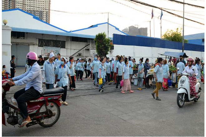
ប្រភព៖khemtimeskh, 2021 រូបភាព៖ Pann Rachana

ប្រភព ៖ postkhmer បើញផ្សាយថ្ងៃទី១៧ ខែមករា ឆ្នាំ២០២២។ ប្រទេសកម្ពុជាជាប់ចំណាត់ថ្នាក់ល្អបំផុតសម្រាប់ការចំណាយប្រតិបត្តិការផលិតកម្មទាបបំផុតក្នុងចំណោមប្រទេសចំនួនប្រាំបួននៅអាស៊ី