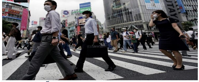
ដោយ ខេមបូឌូមីស

ធនាគារពិភពលោកបានព្យាករចុងក្រោយចំពោះ កំណើនសេដ្ឋកិច្ចសកលលោកនៅឆ្នាំ២០២២ថា នឹង មានកំណើនយឺតត្រឹម៤,១%ប៉ុណ្ណោះ ដែលកាលពីឆ្នាំ ២០២១កើន ៥,៥%។ នៅឆ្នាំ២០២៣ កំណើនសេដ្ឋ កិច្ចពិភពលោកនឹងបន្តថយចុះទៀតមកនៅត្រឹម ៣,២% ដោយសារតែតម្រូវការធ្លាក់ចុះ។ សម្រាប់ការ