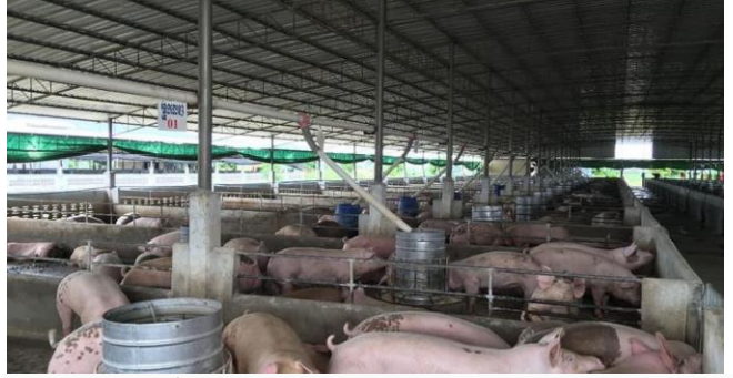
ដោយ ខេមបូឌូមីស

លេខ៣តាមពីក្រោយប្រទេសថៃ និងមីយ៉ាន់ម៉ាតាមពី ក្រោយដោយប្រទេសវៀតណាម។ ដោយ សេន ចន្ទី ប្រភព៖ khmertimeskh, រចនាផ្សាយថ្ងៃទី១៧ខែមករា ឆ្នាំ២០២២ តើទីផ្សារជ្រូកកម្ពុជាអាចរងឥទ្ធិពលជំងឺប៉េស្តជ្រូកអាហ្វ្រិក នៅប្រទេសថៃ ដែរឬយ៉ាងណា?