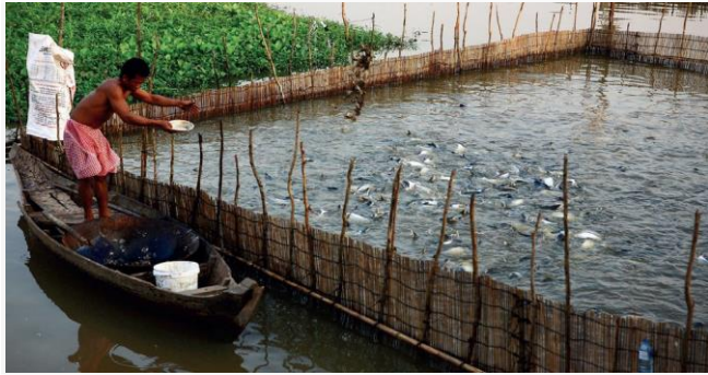
ដោយ ខេមបូណូមីស (រូបតំណាង៖ ការចិញ្ចឹមត្រីនៅកម្ពុជា)

ប្រភព៖ Kampucheahmei ចេញផ្សាយថ្ងៃទី៩ ខែមីនា ឆ្នាំ២០២២។ ក្រុមអ្នកចិញ្ចឹមត្រីថា ចំណីឡើងថ្លៃកាន់តែខ្ពស់ជា បន្តបន្ទាប់ ខណៈតម្លៃទីផ្សារត្រីនៅតែមានទាប