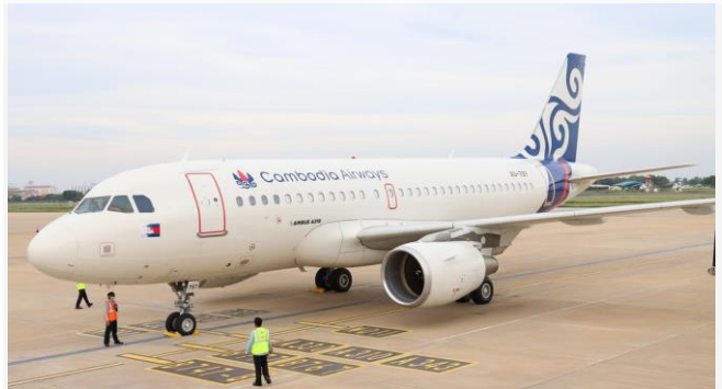
ដោយ ខេមបូណូមីស (ព្រលានយន្តហោះអន្តរជាតិភ្នំពេញ)

ក្រោយការស្នើរបស់ប្រមុខរាជរដ្ឋាភិបាលកម្ពុជា យើងសង្កេតឃើញមានគ្រឹះស្ថានហិរញ្ញវត្ថុឯកជន និងស្ថាប័នរដ្ឋជាច្រើន បានចូលរួមទិញមូលបត្របំណុលមានអ្នកធានារបស់ក្រុមហ៊ុនសាងសង់អាកាសយានដ្ឋានអន្តរជាតិតេជោ ឬព្រលានយន្តហោះអន្តរជាតិភ្នំពេញថ្មីនៅខេត្តកណ្តាលជាបន្តបន្ទាប់។ ជាក់ស្តែង គិតតាំងពីក្រុមហ៊ុន CAIC ដែលជាអ្នកអភិវឌ្ឍន៍គម្រោងអាកាសយានដ្ឋាននេះ បានបោះផ្សាយលក់មូលបត្របំណុលមកទល់បច្ចុប្បន្ន មានស្ថាប័នហិរញ្ញវត្ថុឯកជន និងស្ថាប័ន