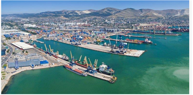
ដោយ ខេមបូឌូណូមីស

ប្រភព ៖ ខេមបូឌូណូមីស ចេញផ្សាយថ្ងៃទី៩ ខែមីនា ឆ្នាំ២០២២។ វិស័យកសិកម្មរបស់រុស្ស៊ីត្រូវជាប់គាំង ដោយសាររងទណ្ឌកម្មពីលោកខាងលិច