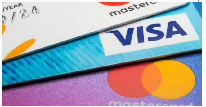
ដោយ ខេមបូណូមីស

ប្រភព ៖ ខេមបូណូមីស ចេញផ្សាយថ្ងៃទី៧ ខែមីនា ឆ្នាំ២០២២។ ធនាគាររុស្ស៊ីប្តូរមកប្រើប្រព័ន្ធភាគ UnionPayរបស់ចិន ក្រោយVisa និង MasterCard បិទប្រតិបត្តិការនៅរុស្ស៊ី