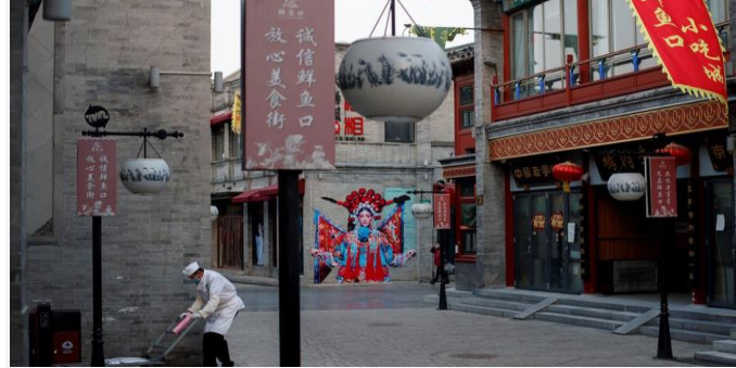
ដោយ ខេមបូឌូណូមីស

ប្រភព ៖ ខេមបូឌូណូមីស ចេញផ្សាយថ្ងៃទី៧ ខែមីនា ឆ្នាំ២០២២។ តើអាជីវកម្មអាមេរិកនឹងចិនជួបភាពអាប្បកម្រិតណាចំពោះរដ្ឋាភិបាលប្រទេសទាំងពីរមានភាពតានតឹងកើនឡើង?