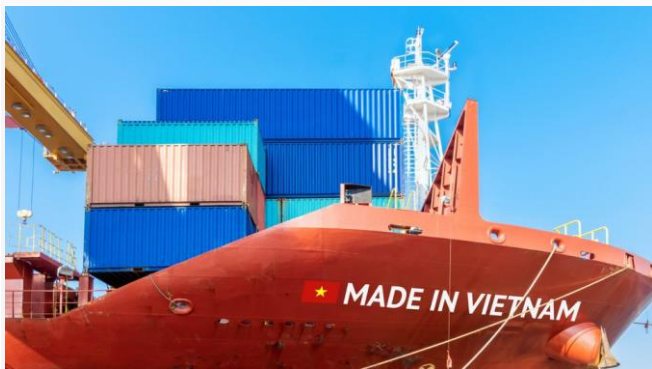
ដោយ ខេមបូណូមីស ( ផែនទីទំនិញរបស់រៀតណាម )

ការនាំចេញរៀតណាមទៅរុស្ស៊ីចាប់ផ្តើមរងប៉ះពាល់ដោយសារតែទណ្ឌកម្មលោកខាងលិច