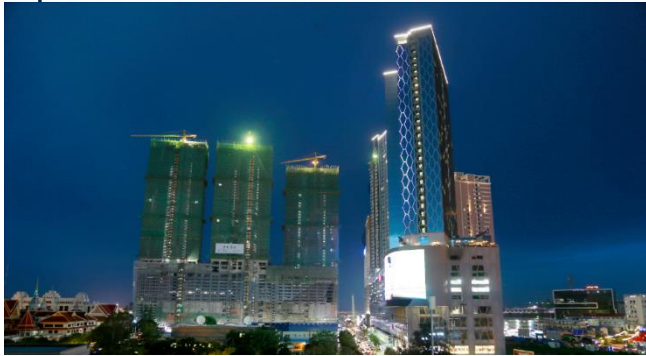
ដោយ ខេមបូណូមីស

អ្នកជំនាញក្នុងវិស័យអចលនទ្រព្យនៅកម្ពុជាមើលឃើញថា សង្គ្រាមរវាងរុស្ស៊ី និងអ៊ុយក្រែន មិនបានជះឥទ្ធិពលធ្ងន់ធ្ងរដល់វិស័យអចលនទ្រព្យ និងការវិនិយោគនៅកម្ពុជានោះទេ។ ក៏ប៉ុន្តែប្រសិនបើសង្គ្រាមនេះវិវត្តក្លាយជាសង្គ្រាមរវាងរុស្ស៊ី និងអឺរ៉ុបប្រាកដណាស់ វានឹងជះឥទ្ធិពលមិនល្អមកលើវិស័យអចលនទ្រព្យ ក៏ដូចជាសេដ្ឋកិច្ចកម្ពុជា ដែលកំពុងរងការគំរាមកំហែងពីវិបត្តិកូវីដ-១៩ប្រភេទអូមីក្រុងស្រាប់។ ប្រសិនបើសង្គ្រាមនេះបានវិវត្តកាន់តែធំនៅក្នុងតំបន់អឺរ៉ុប នោះចង់មិនចង់វានឹងគំរាមកំហែងដល់វិស័យនានា រួមទាំងសេដ្ឋកិច្ចទូទាំងពិភពលោកជាក់ជាមិនខាន។ ប្រធានក្រុមប្រឹក្សាភិបាលនៃក្រុមហ៊ុន លី ហួរ រំពឹងថាសង្គ្រាមរវាងរុស្ស៊ី និងអ៊ុយក្រែននឹងមិនវិវត្តទៅដល់ដាលហូតក្លាយជាសង្គ្រាមលោកនោះទេ។ វិបត្តិនៅអ៊ុយក្រែន វាលើសពីសមត្ថភាពដែលអ្នកវិនិយោគនៅកម្ពុជាត្រូវគិត ហើយអ្នកវិនិយោគក៏មិនគួរគិតពីបញ្ហាខ្លាំងពេកនោះដែរ។ ការអភិវឌ្ឍន៍នឹងមិនអាចរីកចម្រើន ឬដំណើរការទៅមុខបានឡើយ ប្រសិនបើអ្នកវិនិយោគរវល់តែផ្ដោតការយកចិត្តទុកដាក់ខ្លាំងពេកលើវិបត្តិនៅអ៊ុយក្រែន។