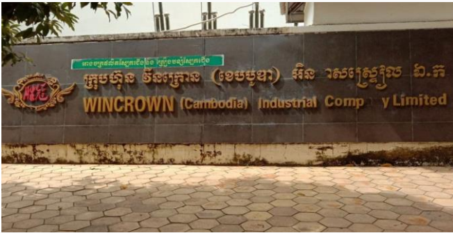
ដោយ ខេមបូឌីស

នៅទីបំផុតកម្ពុជាមានការនាំចេញទំនិញក្រោមកិច្ចព្រមព្រៀងភាពជាដៃគូសេដ្ឋកិច្ចគ្រប់ជ្រុយជ្រោយថ្នាក់តំបន់ (RCEP) ជាលើកដំបូង។ ការនាំចេញនេះ ធ្វើឡើងតាមរយៈក្រុមហ៊ុន Wincrown (Cambodia) Industrial ដើម្បីនាំចេញស្បែកជើងបុរសនារីចំនួន៦ ប្រភេទស្មើនឹងប្រមាណ ៥ ៦០០គូទៅកាន់ទីផ្សារចិនដែលក្រុមហ៊ុនទើបទទួលបានវិញ្ញាបនបត្របញ្ជាក់ដើមកំណើតទំនិញ (CO) ពីក្រសួងពាណិជ្ជកម្មកាលពីពេលថ្មីៗ កាលពីថ្ងៃទី២២ ខែកុម្ភៈ ឆ្នាំ២០២២។ Wincrown បានក្លាយជាក្រុមហ៊ុនដំបូងគេ ដែលបាននាំចេញទំនិញទៅកាន់ទីផ្សារអន្តរជាតិក្រោមកិច្ចព្រមព្រៀង RCEP បន្ទាប់ពីកិច្ចព្រមព្រៀងនេះបានចូលជាធរមានជិតពីរខែកន្លងមកនេះ។