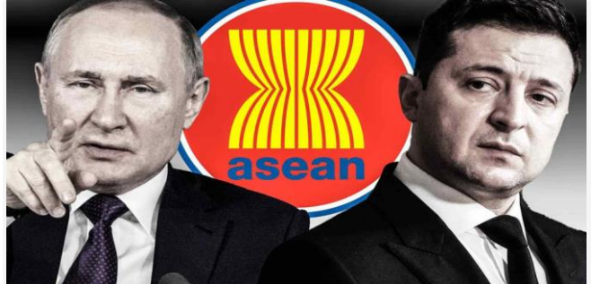
ដោយ ខេមបូឌូស៊ីស(រូបតំណាង)

សង្គ្រាមរវាងរុស្ស៊ី និងអ៊ុយក្រែននៅឆ្ងាយពីតំបន់អាស៊ានក៏ពិតមែន ក៏ប៉ុន្តែបានជះឥទ្ធិពលគួរឱ្យកត់សម្គាល់