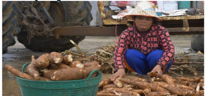
ដោយ ខេមបូឌូនីស

ដំឡូងមីក្រៀមរបស់កម្ពុជានៅឆ្នាំនេះ កំពុងមានទីផ្សារ កាន់តែល្អប្រសើរ។ គួយដឹងថា ក្រសួងពាណិជ្ជកម្ម កម្ពុជា ទើបតែបានសម្របសម្រួលជាមួយខាងភាគីចិន បើកច្រកទីផ្សារនាំចេញដំឡូងមីស្កូតពីកម្ពុជាចំនួន៤០ ម៉ែនតោន ទៅកាន់តំបន់ស្វយ័តជនជាតិជាំងក្រុងស៊ី ប្រទេសចិនចាប់ពី ឆ្នាំ២០២២-២០២៣។ ក្រុមកសិករ និងអាជីវកម្មទិញលក់ដំឡូងមី សង្ឃឹមថា តម្លៃទីផ្សារ ដំឡូងមី អាចនឹងកាន់តែល្អប្រសើរជាងមុន នៅពេល មានការបើកទីផ្សារនាំចេញកាន់តែច្រើន។ ក្រសួង ពាណិជ្ជកម្មកម្ពុជា បានសហការរៀបចំពិធីចុះហត្ថ លេខាស្តីពី កិច្ចសហប្រតិបត្តិការជំរុញពាណិជ្ជកម្ម រវាង អគ្គនាយកដ្ឋានជំរុញពាណិជ្ជកម្ម នៃក្រសួងពាណិជ្ជ