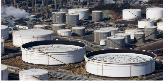
ដោយ ខេមបូណូមីស(រូបតំណាង)

តម្លៃប្រេង និងមាសបន្តហាក់ឡើងថ្លៃបន្ថែមទៀតនៅ ចន្ទ ដើមសប្តាហ៍នេះ ខណៈពេលដែលប្រធានាធិបតីរុស្ស៊ីបានប្រកាសប្រុងប្រយ័ត្នការក្នុងការប្រើអាវុធនុយក្លេអ៊ែររបស់ខ្លួន នៅគ្រាដែលសង្គ្រាមជាមួយអ៊ុយក្រែន កំពុងឆេះឆួលកាន់តែខ្លាំង។ ជាមួយគ្នានេះ ការដាក់ កម្រិតលើការទូទាត់តាមប្រព័ន្ធធនាគារ ក៏បានបង្កើន ការភ័យខ្លាចដល់អ្នកវិនិយោគផងដែរថា ការនាំចេញ ប្រេងពីរុស្ស៊ី ដែលជាប្រទេសផលិតប្រេងធំជាងគេបំផុត ទី២ក្នុងពិភពលោកនោះ អាចនឹងត្រូវមានការរំខាន។ តម្លៃប្រេងនៅទីផ្សារអង់គ្លេស បានឡើងដល់ទៅ លើស១០០ដុល្លារអាមេរិកក្នុងមួយបារ៉ែល កើនឡើង ជាង៧ដុល្លារទៀត។ តម្លៃប្រេងនៅអាមេរិកវិញ ក៏កើន ឡើងជាង៤ដុល្លារ៥០សេនបន្ថែមទៀតដែរ នាំឱ្យ ប្រេង១បារ៉ែលកើនដល់ជាង៩៦ដុល្លារអាមេរិក។ ការ ដាក់ទណ្ឌកម្មដោយអាមេរិក និងអឺរ៉ុប ក្នុងការដក ធនាគាររុស្ស៊ីចេញប្រព័ន្ធទូទាត់សកល SWIFT គឺបាន បង្កកិច្ចការម្តងទៀតឡើងថា ការផ្គត់ផ្គង់ប្រេង។ ក្រៅពីតម្លៃប្រេង មាសបានឡើងថ្លៃខ្ពស់បំផុតមិន ធ្លាប់មានក្នុងរយៈពេល១ឆ្នាំកន្លងមកនេះ។ តម្លៃមាស សម្រាប់ទីផ្សារញ៉ូយក បានកើនឡើងដល់ជិត២ពាន់ ដុល្លារអាមេរិកក្នុងមួយឱន(៨ដីមាស)។ តម្លៃមាស