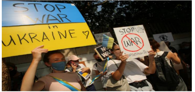
Protesters rally against the Russia-Ukraine conflict in front of the Russian Embassy in Bangkok on Feb 25. Pornprom Satrabhaya

ប្រភព៖ ខេមបូឌាមីស ចេញផ្សាយថ្ងៃទី០១ ខែមីនា ឆ្នាំ២០២២។ ធនាគារជាតិថៃ ព្រមានអំពីអតិផរណាខ្ពស់ជាងមុន ប្រភព