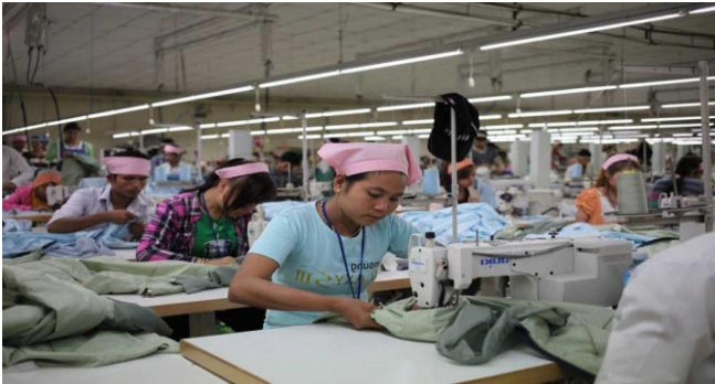
ប្រភព៖ ភ្នំពេញប៉ុស្ដិ៍, ២០២២

យោងតាមតួលេខថ្មីរបស់ក្រសួងការងារនិងបណ្តុះបណ្តាល វិជ្ជាជីវៈបានបង្ហាញថាការផ្ញើប្រាក់សរុបពីពលករចំណាក ស្រុកកម្ពុជាបានកើនឡើងកាលពីឆ្នាំមុន បើទោះបីជា វិបត្តិសេដ្ឋកិច្ចនៅតែបន្តកើតមានដោយជំងឺកូវីដ-១៩ ក៏ ដោយ ខណៈដែលប្រាក់ឈ្នួល និងការផ្ទេរប្រាក់ក្នុងស្រុក សរុបមានចំនួន ៦,៧ ប៊ីលានដុល្លារ។