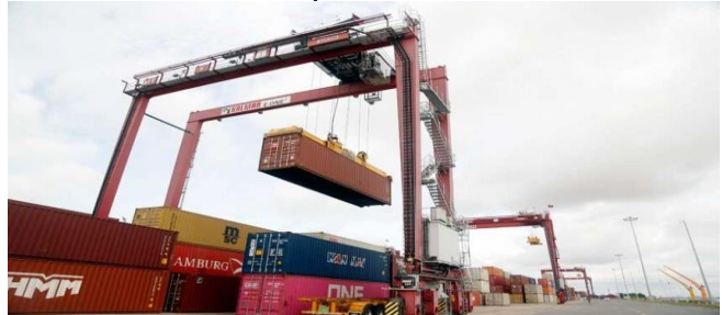
ប្រភព៖ភ្នំពេញប៉ុស្តិ៍, ២០២២ រូបភាព៖ ហេង ជីវ័ន្ត

ផ្សេងទៀតដែលមានចំនួនពលករចំណាកស្រុកកម្ពុជា ច្រើនរួមមាន ម៉ាឡេស៊ី មាន ២៣ ០២៧ នាក់, ជប៉ុន ១១ ៤៥៣ នាក់, សិង្ហបុរី ៨២១ នាក់ ហុងកុង ២០២ នាក់ និង អាហ្វីសាអូឌីត ៤៣ នាក់។ ដោយសេសចន្តី ប្រភព៖ phnompenhpost, រេប៊ុលីកេនថ្ងៃទី២៨ខែកុម្ភៈ ឆ្នាំ២០២២ ការធ្វើពាណិជ្ជកម្មទ្វេភាគីកម្ពុជា និងកូរ៉េខាងត្បូង កើនឡើងជាង៣១%ក្នុងខែមករា ឆ្នាំ២០២២