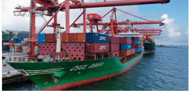
ដោយ ខេមបូឌូមីស (ការនាំចេញទំនិញកម្ពុជានៅកំពង់ផែក្រុងព្រះសីហនុ)

បើសង្គ្រាមរុស្ស៊ី-អ៊ុយក្រែនអូសបន្លាយ ឬបន្តរីករាល ដាល នឹងអាចប៉ះពាល់ដល់ការនាំចេញពីកម្ពុជាទៅអឺរ៉ុប