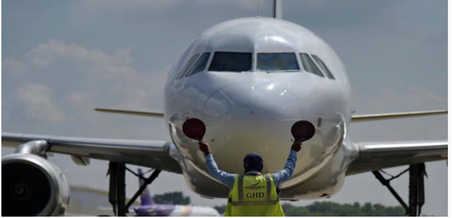
(រូបតំណាង៖ រូបភាពហ្វេសប៊ុក អាកាសយានដ្ឋាន)

តើការហោះហើរពីតំបន់អឺរ៉ុបមកកម្ពុជា អាចរងឥទ្ធិពល ពីវិបត្តិសង្គ្រាមនៅអ៊ុយក្រែនទេ ?