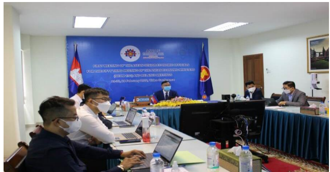
ដោយ វិទ្យុជាតិកម្ពុជា

កាលពីថ្ងៃទី២១-២២ និងថ្ងៃទី២៤ ខែកុម្ភៈ ឆ្នាំ២០២២ នៅទីស្តីការក្រសួងពាណិជ្ជកម្ម អគ្គនាយកពាណិជ្ជកម្មអន្តរ ជាតិ ក្នុងនាមជាប្រធានកិច្ចប្រជុំឧត្តមមន្ត្រីសេដ្ឋកិច្ចអាស៊ាន (SEOM Chair) ក្នុងឆ្នាំ២០២២ បានអញ្ជើញដឹកនាំកិច្ចប្រជុំឧត្តមមន្ត្រីសេដ្ឋកិច្ចអាស៊ានលើកទី១ សម្រាប់កិច្ចប្រជុំរដ្ឋមន្ត្រីសេដ្ឋកិច្ចអាស៊ានលើកទី៥៣ (The First Meeting of the ASEAN Senior Economic Officials for the Fifty-Third Meeting of the ASEAN Economic Ministers – SEOM 1/53) តាមប្រព័ន្ធវីដេអូ ។ កិច្ចប្រជុំនេះមានការចូលរួមដោយអគ្គលេខាធិការរងអាស៊ានទទួលបន្ទុកសសរស្តម្ភសហគមន៍សេដ្ឋកិច្ចអាស៊ាន ឧត្តមមន្ត្រីសេដ្ឋកិច្ចអាស៊ាននៃប្រទេសសមាជិកអាស៊ានទាំងអស់ និងគ