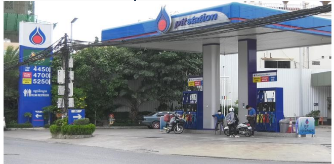
ដោយ ខេមបូឌូមីស

បច្ចុប្បន្ន តម្លៃប្រេងឥន្ធនៈលក់រាយតាមស្ថានីយ៍នីមួយៗ នៅកម្ពុជា បានបន្តកើនឡើងទាំងសាំងស៊ុបពែរ សាំង ធម្មតា និងប្រេងម៉ាសូត។ ជុំវិញបញ្ហានេះ ប្រជាពលរដ្ឋ កម្ពុជា ពិសេសអ្នកប្រកបរបររត់តាក់ស៊ី បានស្នើ រាជរដ្ឋា- ភិបាលកម្ពុជា ជួយកំណោះស្រាយ។ រដ្ឋលេខាធិការប្រចាំការនៃក្រសួងសេដ្ឋកិច្ច និងហិរញ្ញ- វត្ថុ បានគូសបញ្ជាក់ថា ការឡើងថ្លៃប្រេងឥន្ធនៈកំពុង