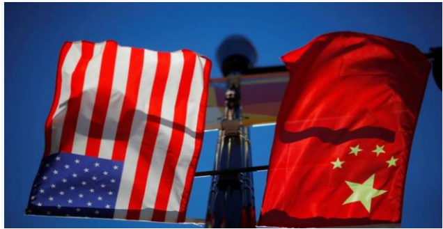
ដោយ ខេមបូណូមីស

ប្រទេសចិន បានរុញច្រានចោលការចោទប្រកាន់របស់ សហរដ្ឋអាមេរិកដែលថា ទីក្រុងប៉េកាំងមិនបានធ្វើតាម ការប្តេជ្ញាចិត្តបើកទីផ្សាររបស់ខ្លួន ដើម្បីចាប់ផ្តើមកិច្ចចរ ចាឡើងវិញស្តីពី ការបញ្ចប់សង្គ្រាមពន្ធគយ។ ដែលនេះ គឺ អាមេរិកកំពុងបង្កើតមធ្យោបាយថ្មី ដើម្បីដោះស្រាយ ជាមួយនឹងយុទ្ធសាស្ត្រពាណិជ្ជកម្មរបស់ចិន។ តំណាងពាណិជ្ជកម្មអាមេរិក បាននិយាយថា ទីក្រុងប៉េ កាំង បានពង្រីកវិធីសាស្ត្រដែលដឹកនាំដោយរដ្ឋ និងមិន មែនជាលក្ខណៈសេដ្ឋកិច្ចទីផ្សារ ដូចដែលបានសន្យា បើកទីផ្សារ នៅពេលដែលចិនបានចូលរួមជាមួយអង្គ-ការពាណិជ្ជកម្មពិភពលោកក្នុងឆ្នាំ២០០១។ ជុំវិញបញ្ហា