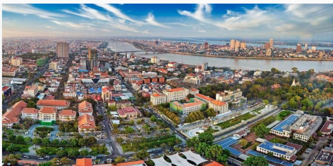
ដោយ ខេមបូណូមីស

បំណុលកម្ពុជា អាចនឹងកើនដល់ ៣៥% នៃ GDP នៅ ឆ្នាំ២០២២