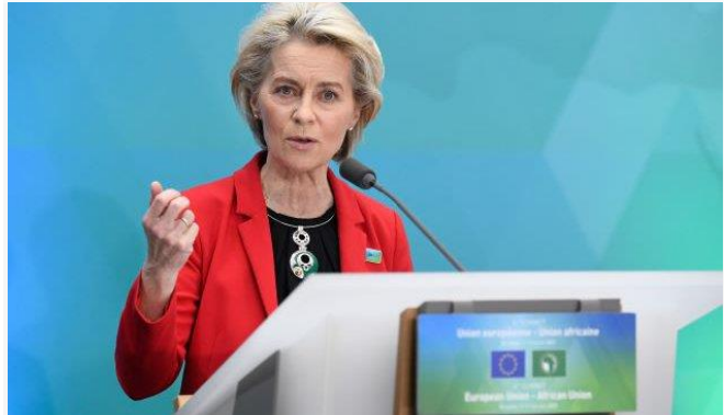
ដោយ ខេមបូណូមីស

ប្រធានគណៈកម្មការអឺរ៉ុប បានបញ្ជាក់ច្បាស់ៗថា ប្រសិន បើរុស្ស៊ីឈ្លានពានអ៊ុយក្រែន នោះរុស្ស៊ីនឹងត្រូវកាត់ផ្តាច់ ពីទីផ្សារហិរញ្ញវត្ថុអន្តរជាតិ និងក៏មិនអនុញ្ញាតឱ្យទទួល បាននូវមុខទំនិញសំខាន់ៗ ដែលផលិតពីលោកខាង លិចនោះទេ ដែលទំនិញទាំងនោះរុស្ស៊ីត្រូវការចាំបាច់ពី