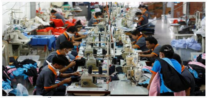
ដោយ ខេមបូឌូមីស

អគ្គលេខាធិការរងសមាគមរោងចក្រកាត់ដេរនៅកម្ពុជា បានគូសបញ្ជាក់ថា គ្លីតកម្ពុជា បានទទួលរងឥទ្ធិពល