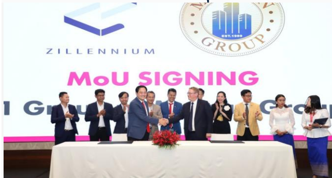
ដោយ ខេមបូណូមីស

កម្ពុជាមានឱកាសកាន់តែប្រសើរ ក្នុងការទាក់ទាញវិនិយោគិនពីប្រទេសសមាជិកសហភាពអឺរ៉ុប មកបណ្តាក់ទុន។ ក្នុងនោះ មានក្រុមហ៊ុនអចលនទ្រព្យជាតិ និងអន្តរជាតិធំៗចំនួន៥ បានសម្រេចចុះអនុស្សាវរណៈយោគយល់គ្នា ដើម្បីបង្កើតឱកាសវិនិយោគថ្មីៗ ក្រុមហ៊ុនធំៗទាំង៥ ដែលបានចាប់ដៃគូលើការវិនិយោគអចលនទ្រព្យនោះ រួមមាន ក្រុមហ៊ុន Zillennium Co., Ltd (Z1 Group), ក្រុមហ៊ុន Z1 Financial, ក្រុមហ៊ុន Century 21 Fortuna Investment, ក្រុមហ៊ុន Mercan Group និងក្រុមហ៊ុន Mercadia Cambodia។