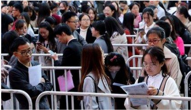
ដោយ ខេមបូណូមីស

តើរដ្ឋាភិបាលចិន មានគោលនយោបាយគាំទ្រអ្វីខ្លះសម្រាប់និស្សិតបញ្ចប់ការសិក្សានៅឆ្នាំ២០២២?