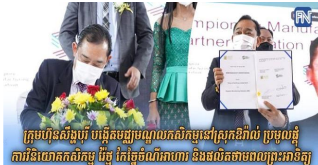
ក្រុមហ៊ុនស៊ីងបុរី បង្កើតមជ្ឈមណ្ឌលកសិកម្មនៅស្រុកឱរ៉ាល់ ប្រមូលផ្តុំការវិនិយោគកសិកម្ម វ៉ែច្នៃ កែច្នៃចំណីអាហារ និងផលិតថាមពលព្រះអាទិត្យ

ក្រុមហ៊ុន អេច អិល អេច អាហ្គ្រីខែលឈ័រ (ខេមបូឌា) លីមីតធីត និង ក្រុមហ៊ុន ហុង ឡែហ្គត គ្រុប លីមីតធីត ដែលជាក្រុមហ៊ុនស៊ីងបុរី បានបង្កើតមជ្ឈមណ្ឌលកសិកម្ម លើផ្ទៃដីប្រមាណ ១ម៉ឺនហិចតា ស្ថិតនៅស្រុកឱរ៉ាល់ ខេត្ត កំពង់ស្ពឺ ដើម្បីប្រមូលផ្តុំការវិនិយោគចុះលើវិស័យកសិកម្ម មានដូចជា ការកែច្នៃចំណីអាហារ ចិញ្ចឹមសត្វ ទឹកនៃកសិកម្ម និងចំណីអាហារព្រះអាទិត្យជាដើម។ ក្រុមហ៊ុនទាំងនេះ បានវិនិយោគលើការដាំពោត និងដំឡូងមី និងកែច្នៃជាម្សៅមីសម្រាប់នាំចេញទៅក្រៅប្រទេសលើទីតាំងខាងលើតាំងពីឆ្នាំ២០០៨មកម៉្លេះ។ ដើម្បីពង្រីកសក្តានុពលនៃការវិនិយោគលើដីសម្បទានសេដ្ឋកិច្ចនេះ ឱ្យកាន់តែខ្លាំងក្លាថែមទៀត ទើបក្រុមហ៊ុនសម្រេចបង្កើតទីតាំងនោះទៅជាមជ្ឈមណ្ឌលកសិកម្មកម្ពុជា-សិង្ហបុរី (CSAH) ដើម្បីកៀរគរអ្នកវិនិយោគផ្នែកកសិកម្មឱ្យចូលរួមវិនិយោគ និងកែប្រែតំបន់នោះ ទៅជាកន្លែងអភិវឌ្ឍន៍ផ្នែកកសិកម្មចម្រុះ និងទំនើបមួយ។