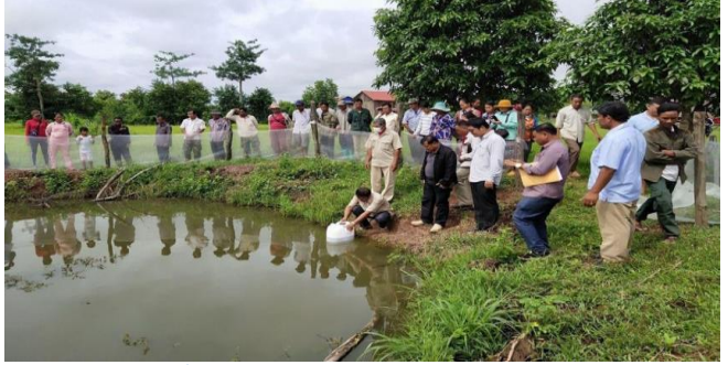
ប្រកប៖ ភ្នំពេញប៉ុស្តិ៍ ២០២២

យោងតាមឯកឧត្តម វេង សាខុន រដ្ឋមន្ត្រីក្រសួងកសិកម្ម រុក្ខាប្រមាញ់ និងនេសាទ ដែលបានជួបពិភាក្សាការងារជាមួយនឹងក្រុមការងាររបស់មូលនិធិអន្តរជាតិសម្រាប់ការអភិវឌ្ឍន៍កសិកម្ម (IFAD) លើការអនុវត្តកម្មវិធីការប្រើប្រាស់បច្ចេកទេសកសិកម្មថ្មីដែលធននឹងការប្រែប្រួលអាកាសធាតុ (ASPIRE) បានលើកឡើងថា៖ កម្មវិធី