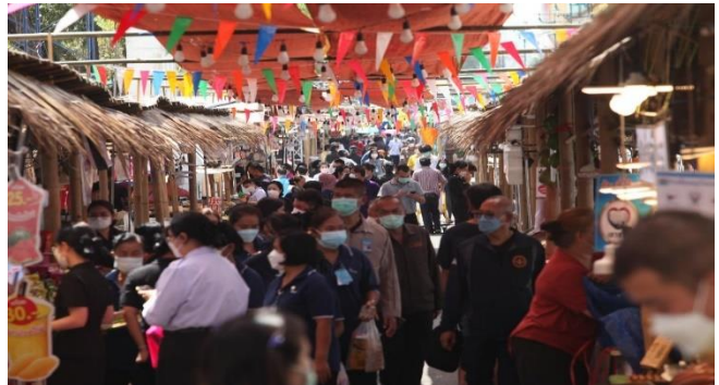
មនុស្សម្នាតិវិញមើលផលិតផលប្រើប្រាស់ក្នុងពិព័រណ៍មួយ ដែលប្រារព្ធធ្វើនៅការិយាល័យរដ្ឋលេខាធិការអចិន្ត្រៃយ៍ក្រសួងការពារជាតិកាលពីថ្ងៃច័ន្ទ។ សហការរៀបចំដោយបារាំង Thong Fah (Blue Flag) របស់នាយកដ្ឋានពាណិជ្ជកម្មក្នុងស្រុក និងក្រសួងការពារជាតិ។

ក្រុមប្រឹក្សាជាតិអភិវឌ្ឍន៍សេដ្ឋកិច្ច និងសង្គមរបស់ថៃ (The National Economic and Social Development Council) បានរក្សាការព្យាករណ៍កំណើនសេដ្ឋកិច្ចរបស់ខ្លួនក្នុងរង្វង់ពី ៣,៥% ទៅ ៤,៥% ដោយរំពឹងទុកថា ផែនការរបស់រាជរដ្ឋាភិបាលនៅក្នុងការទប់ស្កាត់ការរីករាលដាលអូមីក្រុងនឹងទទួលបានភាពជោគជ័យ និងបានរំពឹងថា នឹងពុំមានវិធានការរឹតបន្តឹងថែមទៀត