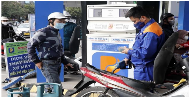
កាលពីថ្ងៃទី១១ ខែកុម្ភៈ តម្លៃប្រេងនៅប្រទេសវៀតណាមបានកើនឡើងដល់ជិត ១ ០០០ដុំក្នុងមួយលីត្រ គឺជាកម្រិតមួយខ្ពស់បំផុតដែលមិនធ្លាប់មានចាប់តាំងពីខែសីហា ឆ្នាំ២០១៤។

កាលពីថ្ងៃទី១១ ខែកុម្ភៈ កន្លងទៅ តម្លៃប្រេងលក់រាយនៅវៀតណាមបានកើនឡើងជិត ១ ០០០ដុំ ក្នុងមួយលីត្រ នេះបើយោងតាមរបាយការណ៍រួមរបស់ក្រសួងពាណិជ្ជកម្ម ឧស្សាហកម្ម និងក្រសួងហិរញ្ញវត្ថុរបស់វៀតណាម។ ក្នុងនោះតម្លៃប្រេងឥន្ធនៈដ៏វៃឧស្ម័ន RON95 បានកើនឡើងពី ៩៦២ដុំដល់ទៅ ២៥ ៣២២ដុំ (១,១២ដុំល្ហានសហរដ្ឋអាមេរិក) ក្នុងមួយលីត្រ គឺជាការកើនឡើងខ្ពស់បំផុតដែលមិនធ្លាប់មានចាប់តាំងពីខែសីហា ឆ្នាំ២០១៤មក។ រដ្ឋមន្ត្រីក្រសួងពាណិជ្ជកម្ម និងឧស្សាហកម្មបាននិយាយថា ស្ថានីយ៍ប្រេងមួយចំនួននៅមានសាំងស្តុកទុកនៅឡើយ ប៉ុន្តែមិនព្រមលក់ ហើយ