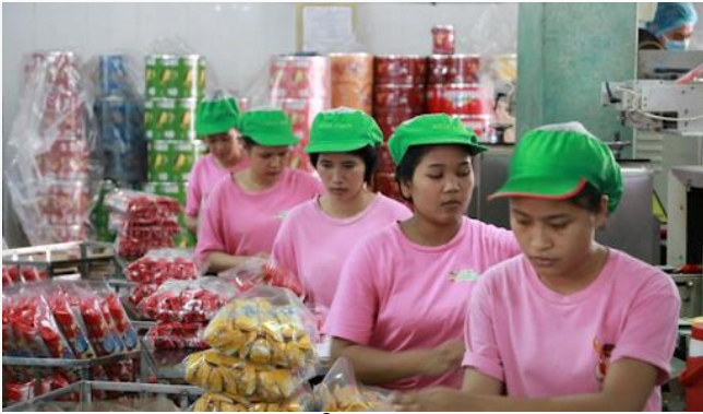
ដោយ ៖ ខេមបូឌូមីស (សកម្មភាពវិច្ច័យស្រូវលើសី)

នៅកម្ពុជា ការប្រើប្រាស់បច្ចេកវិទ្យាឌីជីថល ក្នុងវិស័យ សហគ្រាសខ្នាតតូច និងមធ្យម(SME) មានការកើន ឡើងគួរឱ្យកត់សម្គាល់ ពិសេសក្នុងបរិបទកូវីដ-១៩នេះ តែម្តង។ បច្ចុប្បន្នមានអាជីវកម្ម SME ប្រមាណជា ២/៣ ហើយ កំពុងប្រើប្រាស់បច្ចេកវិទ្យាឌីជីថលក្នុងអាជីវកម្ម។ ស្របនឹងកំណើននេះ រាជរដ្ឋាភិបាលបានបង្កើត ជាបទប្បញ្ញត្តិ និងយន្តការជាច្រើន សំដៅធានាការពារ និងលើកកម្ពស់និរន្តរភាពនៃសេដ្ឋកិច្ច និងសង្គមឌីជីថល នេះផងដែរ។