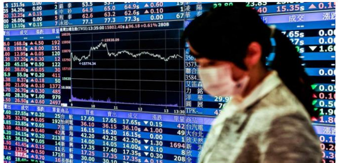
ដោយ ខេមបូឌ្ឍមីស

ផ្សារភាគហ៊ុននៅអាស៊ីនៅថ្ងៃចន្ទដើមសប្តាហ៍នេះ មានការកើនឡើងខ្ពស់ជាងមុន ស្របពេលដែលទីផ្សារភាគហ៊ុននៅ Wall Street នៅមានសភាពទ្រឹង។ ការឈប់សម្រាកចូលបុណ្យចូលឆ្នាំចិន គឺបានធ្វើឱ្យមានឥទ្ធិពលតិចតួច ដោយសន្ទស្សន៍ភាគហ៊ុននៅអាស៊ីប៉ាស៊ីហ្វិកក្រៅពីប្រទេសជប៉ុនបានកើនឡើង ០,៦% នៅក្នុងកម្រិតជួញដូរយឺត។