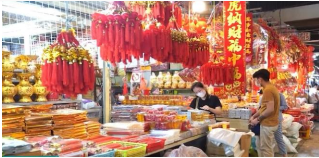
ដោយ ខេមបូណូមីស

នៅអំឡុងថ្ងៃបុណ្យចូលឆ្នាំប្រពៃណីចិន-វៀតណាម ទាំង ប្រជាជនដែលមានដើមកំណើតចិន វៀតណាម និងអ្នក ជាប់សែស្រឡាយចិន បានដើរទិញគ្រឿងរណ្តាប់សែន និង គ្រឿងលម្អតុបតែងផ្ទះសម្បែងដើម្បីសែនព្រេនពិធី បុណ្យចូលឆ្នាំប្រពៃណីចិន វៀតណាម ដែលត្រូវបាន ធ្វើឡើងនៅថ្ងៃទី៣១ ខែមករា ឆ្នាំ២០២២។