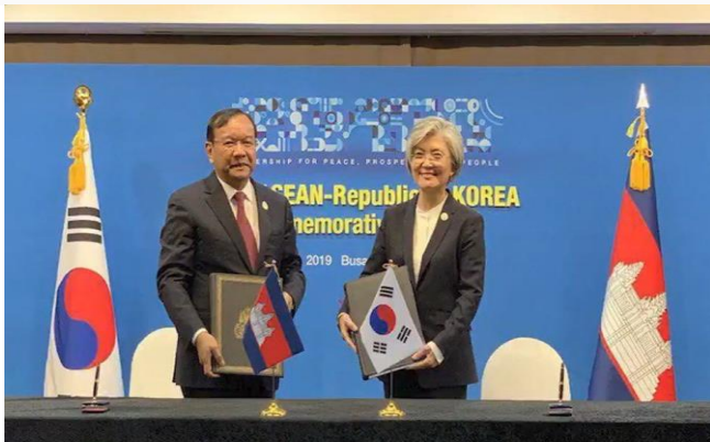
ដោយ ខេមបូណូមីស

កិច្ចព្រមព្រៀងជៀសវាងការយកពន្ធគ្រួតគ្នា (DTA) គឺជាកិច្ចព្រមព្រៀងទ្វេភាគីដ៏សំខាន់បំផុត ក្នុងបរិបទនៃកិច្ចសហប្រតិបត្តិការផ្នែកពន្ធដារអន្តរជាតិ។