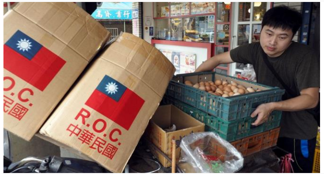
ដោយ ខេមបូឌូនីស

បើទោះបីជាស្ថិតក្រោមសម្ពាធកាន់តែខ្លាំងពីសំណាក់រដ្ឋាភិបាលប៉េកាំង ប៉ុន្តែកោះតៃវ៉ាន់ នៅតែរក្សាជំហរឹងមាំរបស់ខ្លួនទាំងនៅក្នុងផ្នែកនយោបាយ យោធា និងសេដ្ឋកិច្ច។ ជាក់ស្តែង នៅឆ្នាំ២០២១កន្លងទៅនេះ សេដ្ឋកិច្ចកោះតៃវ៉ាន់ សម្រេចបានកំណើនជាង ៦% ធៀបនឹងឆ្នាំ២០២០ ដែលមានកំណើនត្រឹមតែជាង ៣% ប៉ុណ្ណោះ។ នេះគឺជាអត្រាកំណើនលឿនបំផុតមិនធ្លាប់មាន គិតក្នុងរយៈពេលជាង១ទសវត្សរ៍កន្លងមកនេះ