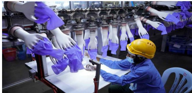
ដោយ ខេមបូឌូមីស

ទីភ្នាក់ងារគយអាមេរិកបានធ្វើការហាមឃាត់ការនាំចូលស្រោមដៃវេជ្ជសាស្ត្ររបស់ម៉ាឡេស៊ី YTY Group ជុំវិញការបង្ខំលើកម្មករលើការអនុវត្តការងារ ដែលនេះផ្អែកលើព័ត៌មានដែលបង្ហាញពីការប្រើប្រាស់កម្លាំងពលកម្មដោយបង្ខំនៅក្នុងប្រតិបត្តិការផលិតកម្មរបស់ក្រុមហ៊ុន YTY Group។ នេះជាការហាមឃាត់លើកទី ៧ ក្នុងរយៈពេលពីរឆ្នាំចុងក្រោយនេះ។ ទីភ្នាក់ងារគយ និងការការពារព្រំដែនសហរដ្ឋអាមេរិកបានរកឃើញស្ថិតិចនាគរចំនួន ៧ ក្នុងចំណោមស្ថិតិចនាគរទាំង ១១នៃពលកម្មដោយបង្ខំ របស់អង្គការពលកម្មអន្តរជាតិ ក្នុងអំឡុងពេលស៊ើបអង្កេតរបស់ខ្លួនទៅលើ YTY Group រួមមាន៖ ការបំភិតបំភ័យ និងការគំរាម