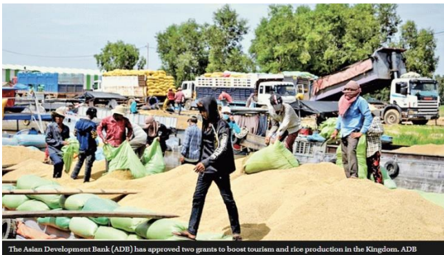
The Asian Development Bank (ADB) has approved two grants to boost tourism and rice production in the Kingdom. ADB