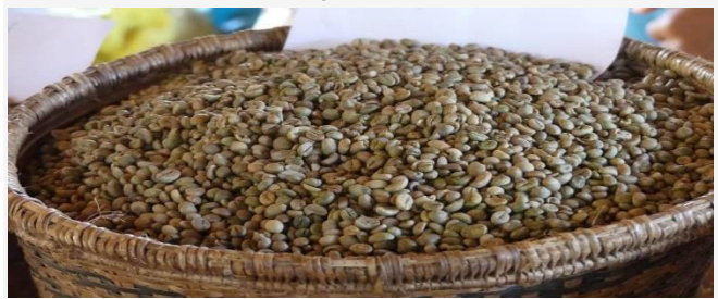
(គ្រាប់កាហ្វេ នៅមណ្ឌលគិរី)

ខេត្តមណ្ឌលគិរី ជាខេត្តមួយដែលមានអំណោយផលលើការដាំដុះដំណាំកសិកម្ម រួមទាំង ដំណាំឧស្សាហកម្មដូចជា កាហ្វេ និងកាកាវ ជាដើម។ សម្រាប់ដំណាំកាកាវ ជាដំណាំថ្មីមួយប្រភេទមានទីផ្សារ មិនចាញ់ដំណាំកាហ្វេនោះដែរ។