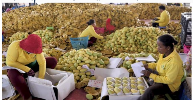
ដោយ ខេមបូណូមីស

ក្រោយពីកម្ពុជា នាំចេញផ្លែស្វាយកែវមៀតត្រង់ទៅកាន់ទីផ្សារចិន និងកូរ៉េខាងត្បូងរួចមក ពេលនេះផ្លែស្វាយកម្ពុជា នឹងមានទីផ្សារថ្មីមួយទៀត។ ឯកអគ្គរដ្ឋទូតអា-