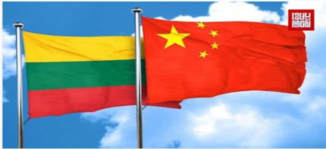
ដោយ ខេមបូឌូនីស

សហភាពអឺរ៉ុបចេញមុខការពារប្រទេសលីទុយអាស៊ី លើបញ្ហាជម្លោះការទូតពាណិជ្ជកម្ម ដោយបានប្តឹងចិនទៅ WTO