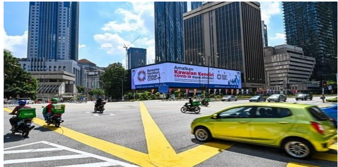
ដោយ ៖ AKP

កិច្ចការលើករណីនេះមានភាពហួសហេតុនាំឱ្យខូចតម្លៃ ទីផ្សារ។ ចំណែកឯឧស្សាហកម្មប្រេងរបស់ជប៉ុនបាន បន្ទោសថា ការឡើងថ្លៃប្រេងនៅប្រទេសជប៉ុនគឺបណ្តាល មកពីរដ្ឋាភិបាលជប៉ុនយកពន្ធលើប្រេងខ្ពស់ពេក។ ព្រោះបើយោងតាមរបាយការណ៍របស់ក្រសួងហិរញ្ញវត្ថុ ជប៉ុន តម្លៃប្រេងសាំងលក់រាយនៅជប៉ុនមួយលីត្រត្រូវ ជាប់ពន្ធដល់ទៅជាង ៥០% ដែលពីមុនពន្ធលើអ្នកប្រើ ប្រាស់ប្រេងសាំងមានទំហំត្រឹមតែ ១០% ប៉ុណ្ណោះ បើ គិតត្រឹមត្រីមាសទី២ ក្នុងឆ្នាំ២០២០។ ដោយ វិទ្យុ ចំនួនស្តីអំពី ប្រភព៖ The Japan Times ចេញផ្សាយ ថ្ងៃទី២៥ ខែមករា ឆ្នាំ២០២២ ម៉ាឡេស៊ី មិនផ្តល់កូតាពិសេសបន្ថែមទៀតសម្រាប់ការ ជ្រើសរើសពលករបរទេស