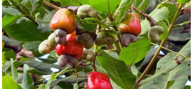
ដោយ ខេមបូណ្ណមីស

ប្រកប្រទេសបុណ្ណមីសចេញផ្សាយថ្ងៃទី២៤ ខែមករា ឆ្នាំ២០២២។ បញ្ហាគួរលេខនាំចេញខុសគ្នា ជាបញ្ហាស្មុគស្មាញសម្រាប់ ការរៀបចំគោលនយោបាយជាតិស្តីពីស្វាយចន្ទី