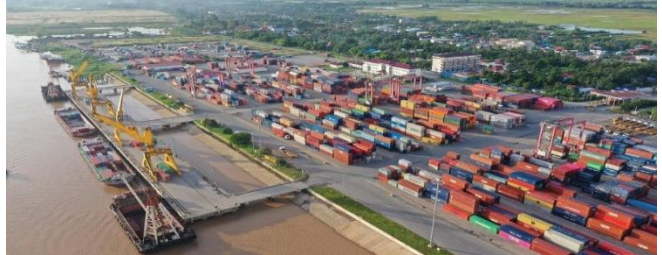
ដោយ ខេមបូឌូមីស

ច្បាប់វិនិយោគថ្មី និងកិច្ចព្រមព្រៀងពាណិជ្ជកម្មសេរី ទ្វេភាគី និងពហុភាគីបានធ្វើឱ្យប្រសើរឡើងនូវឱកាស វិនិយោគ និងការធ្វើធុរកិច្ចនៅកម្ពុជា។ គិតចាប់តាំងពី ថ្ងៃទី១ ដល់ថ្ងៃទី២៣ ខែមករា ឆ្នាំ២០២២ ក្រុមប្រឹក្សា អភិវឌ្ឍន៍កម្ពុជា បានអនុម័តគម្រោងវិនិយោគថ្មីៗចំនួន ២២គម្រោង ជាមួយទុនសរុបដិត២ពាន់លានដុល្លារអា មេរិក និងបានផ្តល់ការងារជូនប្រជាជនជាង២ម៉ឺន កន្លែង ដែលមានការកើនឡើងគួរឱ្យកត់សម្គាល់ បើ ធៀបនឹងរយៈពេលដូចគ្នាកាលពីឆ្នាំមុន។ ជាក់ស្តែង នៅពេញមួយខែមករា ឆ្នាំ២០២១ CDC បានអនុម័ត លើគម្រោងវិនិយោគសរុបតែ១១គម្រោងប៉ុណ្ណោះ។ អនុប្រធានសភាពាណិជ្ជកម្មកម្ពុជា សង្កេតឃើញថា ការវិនិយោគលើគម្រោងថ្មីៗនៅកម្ពុជា មានសន្ទុះកើន ឡើងគួរឱ្យកត់សម្គាល់នៅដើមឆ្នាំ២០២២នេះ។ កត្តា ដែលជំរុញឱ្យការវិនិយោគមានកំណើននេះ គឺ ដោយសារកម្ពុជា បានកែប្រែលក្ខខណ្ឌវិនិយោគល្អ ប្រសើរជាងមុន តាមរយៈការធ្វើវិសោធនកម្មច្បាប់ស្តីពី ការវិនិយោគនៅកម្ពុជា។ ម្យ៉ាងទៀត កម្ពុជាមានកិច្ច ព្រមព្រៀងភាពជាដៃគូសេដ្ឋកិច្ចគ្រប់ជ្រុងជ្រោយ ថ្នាក់