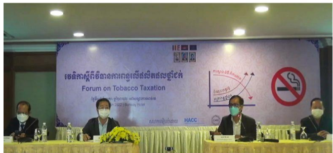
ដោយ ៖ Postkhmer

ប្រភព៖ខេមបូណូមីស ចេញផ្សាយថ្ងៃទី២៥ខែមករា ឆ្នាំ២០២២ NGO១០០ស្ថាប័នស្នើរដ្ឋាភិបាលដំឡើងពន្ធថ្នាំជក់