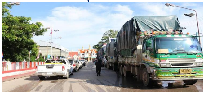
ប្រភព៖ ខ្មែរថាម ២០២២

យោងតាមក្រសួងពាណិជ្ជកម្មរបស់ថៃបានបង្ហាញថា ពាណិជ្ជកម្មទ្វេភាគីរវាងកម្ពុជា និងថៃមានតម្លៃ ៧,៩៧