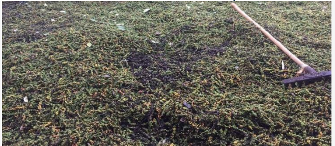
ដោយ ខេមបូឌូណូមីស(គ្រាប់ម្រេចហាល)

វៀតណាម បច្ចុប្បន្ន គឺជាទីផ្សារម្រេចដ៏ធំរបស់កម្ពុជា ដោយទិញពីកម្ពុជាដើម្បីកែច្នៃ និងនាំចេញបន្តទៅ ប្រទេសទី៣។ បច្ចុប្បន្ន ខណៈដែលតម្រូវការទីផ្សារពី អន្តរជាតិមានកាន់តែច្រើន ប៉ុន្តែការដាំម្រេចនៅវៀត ណាមនៅមានកម្រិត ដូច្នេះ វៀតណាមអាចនឹងត្រូវការ នាំចូលម្រេចពីកម្ពុជាកាន់តែច្រើនបន្ថែមទៀត។ ប្រធានសមាគមម្រេចកំពត យល់ឃើញថា ទីផ្សារម្រេច នាពេលបច្ចុប្បន្ន កាន់តែប្រសើរ បើប្រៀបនឹងរយៈពេល ប៉ុន្មានឆ្នាំមុន។ អ្នកដាំម្រេច នៅខេត្តត្បូងឃ្មុំ និងអ្នកដាំម្រេច ក្នុងខេត្ត កំពត បានបង្ហាញនូវអារម្មណ៍សប្បាយរីករាយ ព្រោះតែ តម្លៃម្រេចនាពេលនេះប្រសើរជាងឆ្នាំមុនៗ។ នៅដើម ឆ្នាំ២០២២ ម្រេចនៅខេត្តត្បូងឃ្មុំ មានតម្លៃ ១ម៉ឺន៥ ពាន់រៀល ក្នុងមួយគីឡូក្រាម បើប្រៀបនឹងឆ្នាំ២០២១