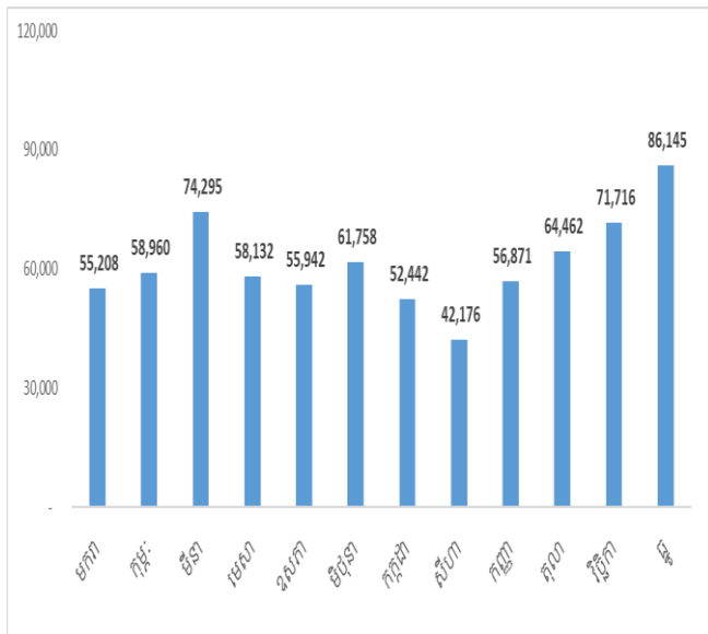
តារាងលក់រថយន្តប្រចាំខែរបស់(FTI)ឆ្នាំ២០២១ (គ្រឿង)