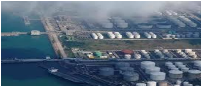
ប្រភព៖ Newsbreak ២០២១

ប្រជាពលរដ្ឋ។ ជាក់ស្តែង ការទូទាត់បំណុលខាងក្រៅ ទាំងអស់នៃប្រទេសមានចំណូលទាប និងមធ្យម ក្នុង នោះ ៤៧%ទៅកាន់ម្ចាស់បំណុលឯកជន ២៧%ទៅ កាន់ស្ថាប័នពហុភាគី ១២%ទៅកាន់ចិន និង១៤%ទៅ កាន់រដ្ឋាភិបាលប្រទេសដទៃទៀត។ ដោយ ជា សិរីភីត ប្រភព៖ CNBC ចេញផ្សាយ ថ្ងៃទី២៤ ខែមករា ឆ្នាំ២០២២ សេដ្ឋកិច្ចប្រទេសឈូងសមុទ្រ នឹងមានកំណើនលឿន នៅឆ្នាំ២០២២