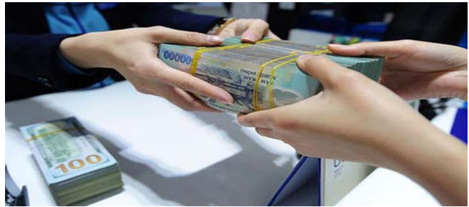
ប្រភព៖ Vietnam News cafe.vn

ប្រាក់បញ្ញើរបស់អតិថិជននៅក្នុងធនាគារទាំងអស់ នៅក្នុងប្រទេសវៀតណាមកាលពីឆ្នាំ២០២១ កើន ឡើងត្រឹមតែ ២,៦៣% ប៉ុណ្ណោះ គឺជាកំណើនទាប បំផុតដែលមិនធ្លាប់មានក្នុងអំឡុងពេលជាច្រើនឆ្នាំ កន្លងមកនេះ។ ទឹកប្រាក់បញ្ញើសរុបសម្រាប់ខែវិច្ឆិកា ក្នុងឆ្នាំ២០២១ មានចំនួន ២២៦ប៊ីលានដុល្លារ ធ្លាក់ ចុះទាបជាងខែតុលាចំនួន ២៣,៤ទ្រីលានដុង។ កំណើននៃប្រាក់បញ្ញើធ្លាក់ចុះដោយសារតែវិបត្តិកូវីដ ១៩ បានធ្វើឱ្យប្រាក់ចំណូលរបស់ពលរដ្ឋមួយ ចំនួនធំមានការធ្លាក់ចុះគួរឱ្យកត់សំគាល់។ ម្យ៉ាងវិញ ទៀត ដោយសារតែក្នុងអំឡុងពេលរីករាលដាលកូវីដ ១៩ រដ្ឋាភិបាលបានដាក់ចេញវិធានការរក្សាគម្លាត