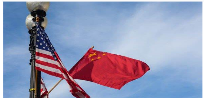
ដោយ ខេមបូណូមីស

លោក ចូ បៃឌិន៖ មិនទាន់ដល់ពេលដែលត្រូវដករនាំង ពន្ធគយពីទំនិញចិនឡើយ