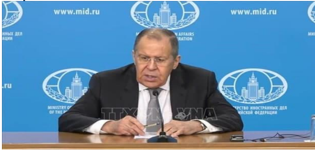
ដោយ ៖ AKP

ទិសដៅការទូតរបស់ប្រទេសរុស្ស៊ីនៅក្នុងឆ្នាំ២០២២ គឺមើលឃើញនូវអនាគតដ៏ល្អ ក្នុងការធ្វើឱ្យកាន់តែស៊ីជម្រៅថែមទៀតនូវភាពជាដៃគូឈ្នះ-ឈ្នះ ជាមួយបណ្តាប្រទេសទាំងអស់ជាសមាជិកអាស៊ាន។ ប្រទេសរុស្ស៊ី នឹងផ្តោតទៅលើការបង្កើនសក្តានុពលនៃកិច្ចសហប្រតិបត្តិការក្នុងវិស័យ សេដ្ឋកិច្ច ពាណិជ្ជកម្ម វិទ្យាសាស្ត្រ នយោបាយ សន្តិសុខ និងបច្ចេកវិទ្យា ហើយសង្ឃឹមថា នឹងពង្រឹងកិច្ចសហប្រតិបត្តិការជាមួយបណ្តាប្រទេសនៅអាស៊ានក្នុងវិស័យវប្បធម៌ សកម្មភាពមនុស្សធម៌ និងការបន្តសកម្មភាពទេសចរណ៍ឡើងវិញបន្ទាប់ពីមានការរំខានរយៈពេលពីរឆ្នាំដោយសារផលប៉ះពាល់នៃជំងឺរាតត្បាតកូវីដ-១៩។ នៅក្នុងឆ្នាំ២០២២ ប្រទេសរុស្ស៊ីគ្រោងនឹងរៀបចំកិច្ចប្រជុំជាទៀងទាត់រវាងគណៈកម្មាធិការអន្តររដ្ឋាភិបាល កិច្ចពិគ្រោះយោបល់ថ្នាក់ក្រសួងការបរទេស និងកិច្ចប្រជុំកម្រិតខ្ពស់នានា ជាមួយបណ្តាប្រទេសមួយចំនួននៅអាស៊ីអាគ្នេយ៍។ រុស្ស៊ីគាំទ្រគ្នាទីឈានមុខគេរបស់អាស៊ាន ក្នុងការស្វែងរកការគាំទ្រអន្តរជាតិ ប្រកបដោយភាពស្ថាបនាសម្រាប់មីយ៉ាន់ម៉ា។ ប្រទេសរុស្ស៊ី មានឆន្ទៈក្នុងការធ្វើការងារជាមួយដៃគូអាស៊ាន ក្នុងការផ្តល់ជំនួយមនុស្សធម៌ដល់ប្រទេសមីយ៉ាន់ម៉ា រួមទាំងការគាំទ្រក្នុងការ