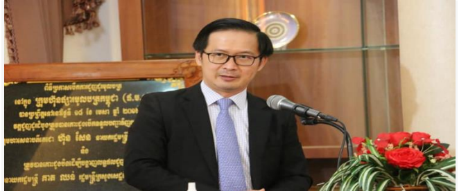
ដោយ ខេមបូណូមីស(អគ្គនាយកដ្ឋានមូលបត្រកម្ពុជា CSX)

ប្រភព ៖ postkhmer ចេញផ្សាយថ្ងៃទី១៩ ខែមករា ឆ្នាំ២០២២ CSXបំណែកកំណត់ត្រាការដេញដូរភាគហ៊ុនឆ្នាំ២០២១