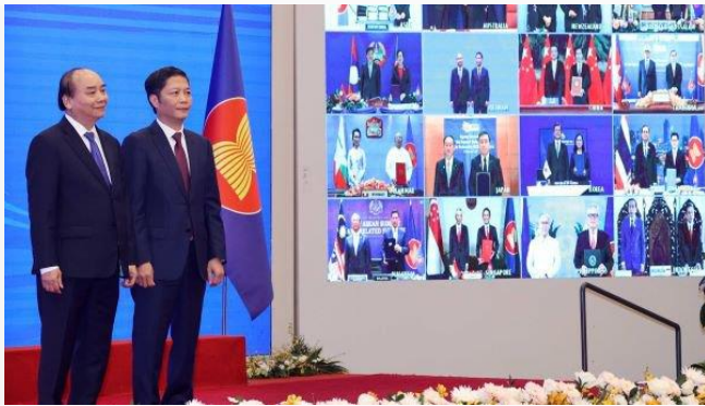
ដោយ ខេមបូណូមីស

អ្នកជំនាញសេដ្ឋកិច្ច និងអ្នកជំនាញធំៗនៅវៀតណាម អះអាងថា កិច្ចព្រមព្រៀងពាណិជ្ជកម្មដ៏ធំបំផុតរបស់ ពិភពលោក គឺកិច្ចព្រមព្រៀងពាណិជ្ជកម្មភាពជាដៃគូ សេដ្ឋកិច្ចគ្រប់ជ្រុងជ្រោយតំបន់ ដែលហៅកាត់ថា RCEP នឹងជំរុញពាណិជ្ជកម្មវៀតណាមក្នុងរយៈពេល វែង នឹងក្លាយជាផ្នែកមួយនៃខ្សែសង្វាក់ផ្គត់ផ្គង់កាន់តែ ធំទៅកាន់ពិភពលោក។ ក្នុងនោះដែរ ប្រទេសចិន និង ជប៉ុន កំពុងក្លាយជាគោលដៅទីផ្សារដ៏សំខាន់សម្រាប់ វៀតណាមក្នុងការនាំចេញតាមរយៈកិច្ចព្រមព្រៀង RCEP នេះ។