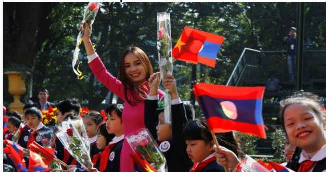
ដោយ ខេមបូឌូណូមីស (រូបតំណាងពាណិជ្ជកម្មវៀតណាម និងឡាវ)

នៅពេញមួយឆ្នាំ២០២១នេះ ទំហំពាណិជ្ជកម្មរវាងវៀតណាម និងឡាវ មានប្រមាណ ១ ៣០០លានដុល្លារអាមេរិក កើនប្រមាណ៣០% បើធៀបនឹងឆ្នាំ២០២០។ ចំពោះវៀតណាម និងកម្ពុជាគិតត្រឹម១១ខែ ឆ្នាំ២០២១សម្រេចបានដល់ទៅជាង៨ ០០០លានដុល្លារ កើនឡើងជាង៨៤%។ ការប្រៀបធៀបទំហំពាណិជ្ជកម្មរវាងវៀតណាម និងឡាវមានតូចជាង រវាងវៀតណាម ជាមួយកម្ពុជា។ ប៉ុន្តែចំពោះការវិនិយោគវិញ បច្ចុប្បន្ននេះវៀតណាមមានគម្រោងវិនិយោគដែលមានសុពលភាពចំនួន ២០៩ នៅឡាវក្នុងដើមទុនចុះបញ្ជីសរុបប្រមាណជាង ៥ ០០០លានដុល្លារអាមេរិក។ ហើយកាលពីឆ្នាំ២០២១ បានវិនិយោគលើគម្រោងថ្មីចំនួន៥ បន្ថែមទៀត។ គម្រោងទាំងនោះកំពុងមានសកម្មភាពល្អ បង្កើតការងារដ៏មានស្ថិរភាពសម្រាប់ពលកររាប់ម៉ឺននាក់ និងរួមចំណែកយ៉ាងសំខាន់ក្នុងដំណើរការជំរុញវិស័យសេដ្ឋកិច្ចឡាវផងដែរ។ ដោយឡែក ការវិនិយោគរបស់វៀតណាមនៅកម្ពុជា គិតមកដល់បច្ចុប្បន្ននេះ មានលើគម្រោងចំនួន១៨គម្រោង និងមានទុនចុះបញ្ជីសរុបជាង២៨០០លានដុល្លារអាមេរិក។ ហើយនៅត្រឹម១១ខែ ឆ្នាំ២០២១ វៀតណាមបានវិនិយោគគម្រោងថ្មីចំនួន ៤គម្រោងនៅកម្ពុជា ដែលមានដើម