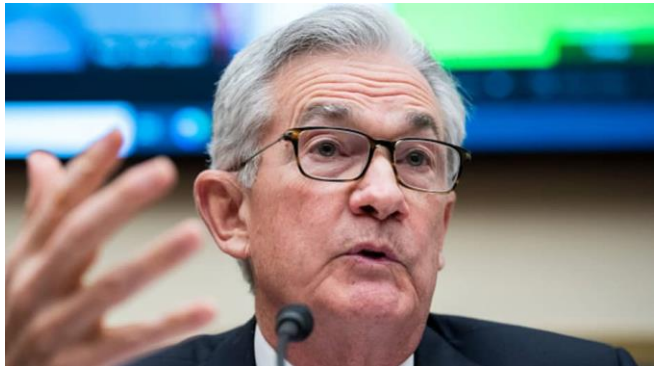
ប្រធានធនាគារកណ្តាលលោក Jerome Powell ថ្លែងនៅក្នុងកិច្ចប្រជុំការគណៈកម្មាធិការសេវាហិរញ្ញវត្ថុរបស់សភា ស្តីពីការត្រួតពិនិត្យរបស់នាយកដ្ឋានធនាគារ និងការឆ្លើយតបចំពោះដំណើរការត្រួតពិនិត្យរបស់ធនាគារកណ្តាលនៅអាគារ Rayburn ថ្ងៃពុធ ទី០១ ខែ ធ្នូ ឆ្នាំ២០២១។

ការរំពឹងទុករបស់អ្នកប្រើប្រាស់ចំពោះអតិផរណាមិន មានការប្រែប្រួលទេ ខណៈដែលធនាគារ Goldman Sachs បានព្យាករណ៍ឃើញថា ធនាគារកណ្តាលរបស់ សហរដ្ឋអាមេរិក នឹងបង្កើនអត្រាការប្រាក់ ៤ដងនៅក្នុង ឆ្នាំនេះ