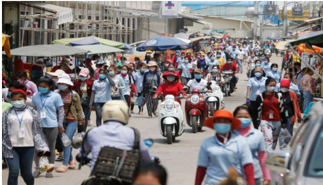
ប្រកព្រះភ្នំពេញប៉ុស្ដិ៍, ២០២១

កំណើននៃការបញ្ជាទិញផលិតផលធ្វើដំណើរ និង ស្បែកជើងពីទីផ្សារក្រៅប្រទេស និងការបើករោងចក្រ ថ្មីៗជាបន្តបន្ទាប់កំពុងធ្វើឱ្យវិស័យនេះប្រឈមនឹងការ ខ្វះខាតកម្លាំងពលកម្ម។