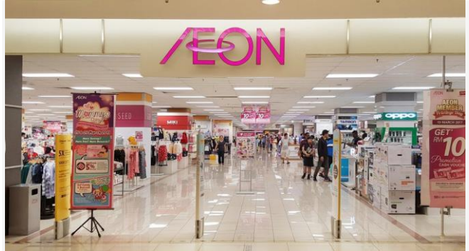
ដោយ ខេមបូឌូមីស (ការដើរទិញទំនិញនៅផ្សារទំនើប Aeon នៅប្រទេសជប៉ុន)

ក្រុមហ៊ុនដ៏ធំរបស់ជប៉ុន Aeon មានគោលដៅផ្តល់សេវាកម្មដឹកជញ្ជូន និងចែកចាយជាអន្តរជាតិនៅក្នុងប្រទេសកម្ពុជា។ សេវាកម្មនេះត្រូវបានទាក់ទាញដោយការកើនឡើងនៃពាណិជ្ជកម្មអេឡិចត្រូនិក និងពាណិជ្ជកម្មឆ្លងព្រំដែនរបស់តំបន់អាស៊ីអាគ្នេយ៍។ ផ្សារទំនើប អ៊ីអេសម៉ល (Aeon Mall) ដែលជាក្រុមហ៊ុនបុត្រសម្ព័ន្ធរបស់ Aeon គ្រោងនឹងសាងសង់មជ្ឈមណ្ឌលដឹកជញ្ជូន ទំហំប្រហែល៣ម៉ឺនម៉ែត្រការ៉េ នៅក្នុងតំបន់សេដ្ឋកិច្ចពិសេសក្បែរកំពង់ផែ ភាគខាងត្បូងនៃខេត្តព្រះសីហនុ ដែលគ្រោងចាប់ផ្តើមដំណើរការនៅក្នុងឆ្នាំ២០២៣។ គម្រោងមជ្ឈមណ្ឌលដឹកជញ្ជូននេះ គឺបង្កើតជាទីតាំងស្តុកទំនិញនាំចូល សេវារ៉ាប់ប្រាក់គយព្រមទាំងជួយដល់ការលក់រាយតាមអ៊ិនធឺណិតឆ្លងព្រំដែនផងដែរ ធ្វើឱ្យកម្ពុជាក្លាយជាទីតាំងស្តុកទំនិញដ៏សំខាន់ និងដំបូងគេរបស់ Aeon នៅក្នុងតំបន់។ អ្នកនាំទំនិញចូលពីក្រៅប្រទេស អាចស្តុកទំនិញនៅទីនេះដោយមិនចាំបាច់បង់ថ្លៃកាតព្វកិច្ច មុនពេលឆ្លងកាត់និរតិវិធីរបស់អាជ្ញាធរគយ។ ចំពោះពាណិជ្ជកម្មតាមប្រព័ន្ធអេឡិចត្រូនិក ឬ E-Commerce អន្តរជាតិនៅក្នុងតំបន់ក៏កំពុងមានការពង្រីកកាន់តែខ្លាំងឡើងដែរ។ តួយ៉ាងក្រុមហ៊ុនពាណិជ្ជកម្មតាមប្រព័ន្ធអេឡិចត្រូនិកយក្សរបស់ចិនគឺ Alibaba Group ក៏បានផ្តោតការយកចិត្តទុកដាក់មកលើទីផ្សារកម្ពុជាដែរ នៅប៉ុន្មានឆ្នាំចុងក្រោយនេះ ហើយក្រុមហ៊ុនធំៗរបស់ជប៉ុនក៏កំពុងមានផ្តល់សេវាកម្មជាច្រើននៅកម្ពុជាដែរ។