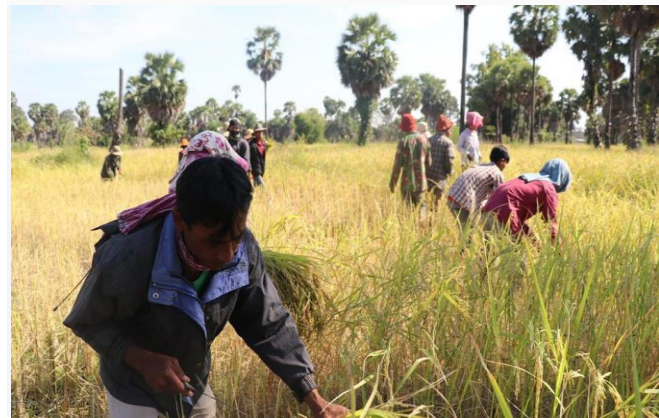
កសិករក្នុងខេត្តបាត់ដំបងកំពុងប្រតិបត្តិការ

វិស័យកសិកម្ម ត្រូវការសេវាធានារ៉ាប់រងដើម្បីធានាការ រីកចម្រើន