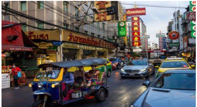
ប្រភព៖ The Business Times, រូបភាព៖ AFP

ធនាគារកណ្តាលប្រទេសថៃ បានលើកឡើងកាលពីពេល ថ្មីៗនេះថា ការរីករាលដាលនៃវីរុសអូមីក្រុង បានបង្កឱ្យ មានភាពមិនប្រាកដប្រជា ដែលជាលទ្ធផលធ្វើឱ្យ កំណើនសេដ្ឋកិច្ចមានកម្រិតទាបជាងសេណារីយ៉ូ គោល សម្រាប់រយៈពេល ៦ខែដំបូង ក្នុងឆ្នាំ២០២២។ ដោយឡែក ស្ថានភាពការផ្ទុះឡើងនៃវីរុសប្រភេទថ្មី អូមី