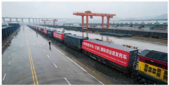
ដោយ ខេមបូឌូមីស (រថភ្លើងដឹកដំឡូងទំនិញនៅប្រទេសចិន)

ប្រទេសថៃ បានមើលឃើញឱកាសល្អនៃការធ្វើពាណិជ្ជកម្មឆ្លងដែន ហើយបានគ្រោងនឹងចរចាជាមួយរដ្ឋាភិបាលឡាវ និងចិន សម្រាប់កិច្ចសហប្រតិបត្តិការដឹកដំឡូង