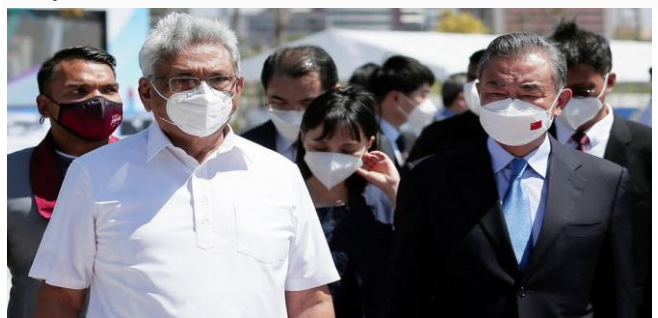
ដោយ ខេមបូណូមីស

ស្រីលង្កាជាប្រទេស ដែលមានសេដ្ឋកិច្ចតឹងផ្អែកខ្លាំង លើវិស័យទេសចរណ៍ ប៉ុន្តែដោយសាររងគ្រោះធ្ងន់ធ្ងរពី វិបត្តិជំងឺរាតត្បាតកូវីដ១៩ បានធ្វើឱ្យប្រទេសនេះ ខាត បង់ប្រាក់ជាច្រើនពីប្រកបចំណូលវិស័យទេសចរណ៍ដ៏ ចម្បងមួយនេះ។ ស្រីលង្កាបាននិងកំពុងជួបវិបត្តិខ្លះ ថវិកាខ្លាំង រហូតដល់ត្រូវបង្ខំចិត្តឱ្យរដ្ឋាភិបាល ដកលុយ ពីកញ្ចប់បម្រុងរូបិយប័ណ្ណបរទេសទៅចាយវាយ ដោះ ស្រាយបញ្ហាមួយគ្រាសិនផងដែរ។ ស្រីលង្កាបានទទួល អត្ថប្រយោជន៍ច្រើន ពីកម្ចីរាប់ពាន់លានដុល្លារពីទីក្រុង ប៉េកាំង។ ប្រទេសចិនបានផ្តល់កម្ចីសម្រាប់គម្រោងផ្លូវ ល្បឿនលឿន, កំពង់ផែ, ព្រលានយន្តហោះ និងរោង ចក្រថាមពលដើរដោយធួនថ្មជាដើម ប៉ុន្តែមិនបាន ផ្តល់ផលប្រយោជន៍ដូចអ្វីដែលបានរំពឹងទុកនោះទេ។ បច្ចុប្បន្នប្រទេសមួយនេះកំពុងធ្លាក់ចុះទៅក្នុងវិបត្តិ ហិរញ្ញវត្ថុកាន់តែអាក្រក់ទៅៗ។ គិតត្រឹមដំណាច់ខែវិច្ឆិ