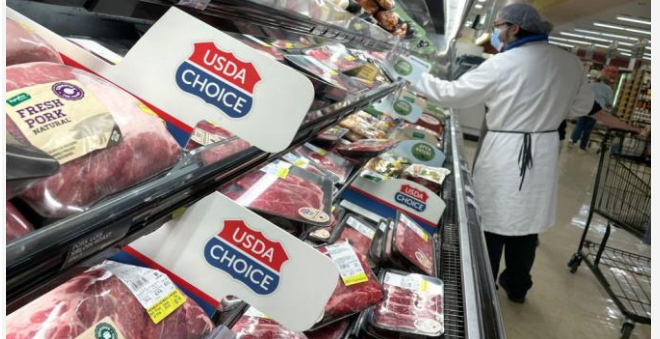
ដោយ ខេមបូណូមីស(INDIA US PORK IMPORT)

ប្រទេសឥណ្ឌាបានអនុញ្ញាតឱ្យនាំចូលសាច់ជ្រូក និងផលិតផលសាច់ជ្រូករបស់អាមេរិកឡើងវិញ ក្រោយពីបានផ្អាកអស់មួយរយៈទំ។ អាមេរិកបានសម្លឹងឃើញឥណ្ឌាជាទីផ្សារដ៏មានសក្តានុពលសម្រាប់ទំនិញរបស់ខ្លួន ជាពិសេសក្រោយទំនាក់ទំនងរវាងឥណ្ឌា និងចិនកាន់តែតានតឹងទៅៗ ដែលនេះជាឱកាសថ្មីមួយ ដើម្បីទទួលបានទីផ្សារសម្រាប់សាច់ជ្រូកអាមេរិកទៅកាន់ប្រទេសឥណ្ឌា ហើយវាជាសញ្ញានៃសកម្មភាពវិជ្ជមាននៅក្នុងទំនាក់ទំនងពាណិជ្ជកម្ម រវាងសហរដ្ឋអាមេរិកនិងឥណ្ឌាផងដែរ។ ប្រទេសទាំងពីរបានចុះហត្ថលេខាលើកិច្ចព្រមព្រៀង ដើម្បីអនុញ្ញាតឱ្យមានការនាំចូលទៅកាន់ទីផ្សារសហរដ្ឋអាមេរិកនូវផ្លែស្វាយ និងផ្លែទទឹមរបស់ឥណ្ឌា ហើយអាមេរិកក៏បាននាំចូលទៅកាន់ប្រទេសឥណ្ឌាវិញនូវផលិតផលកសិកម្មមួយចំនួនផងដែរ។