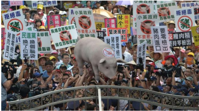
ដោយ ខេមបូណូមីស

កាលពីឆ្នាំ២០០០មក កោះតៃវ៉ាន់បានដាក់បម្រាមមិនឱ្យនាំសាច់គោអាមេរិកចូលក្នុងដែនកោះរបស់ខ្លួនទេ ក្រោយពីមានផ្ទុះជំងឺលើសត្វគោ និងជ្រូកនៅសហរដ្ឋអាមេរិក។ នាឆ្នាំ២០២០ ថ្នាក់ដឹកនាំកោះតៃវ៉ាន់បានលើកបម្រាមនេះចេញដោយសារតែឥទ្ធិពលនយោបាយ និងទំនាក់ទំនងជាមួយអាមេរិក ហើយក៏បានអនុញ្ញាតឱ្យនាំចូលសាច់គោ និងសាច់ជ្រូកពីអាមេរិកឡើងវិញ ទោះដឹងថាមានសារធាតុគីមីប៉ះពាល់ដល់សុខភាពក៏ដោយ។ ប្រការនេះធ្វើឱ្យសាច់ជ្រូកអាមេរិកដែលចិញ្ចឹមដោយប្រើថ្នាំគីមី រ៉ាក់តូប៉ាមីន (ractopamine) បំប៉នអាចជ្រៀតចូលក្នុងទីផ្សារតៃវ៉ាន់បានឡើងវិញដែរ។ រ៉ាក់តូប៉ាមីន (ractopamine) ជាសារធាតុគីមីបំប៉នសត្វ ដែលធ្វើឱ្យសត្វ ធាត់ទ្រលក់ទ្រលន់សាច់ពេញ មានប្រើប្រាស់ច្រើនក្នុងកសិកម្មចិញ្ចឹមសត្វនៅតំបន់អាមេរិកខាងជើង តែថ្នាំនេះត្រូវជាប់បម្រាមមិនឱ្យប្រើប្រាស់ទេ នៅតំបន់អឺរ៉ុប ប្រទេសរុស្ស៊ី និងនៅប្រទេសចិន ហើយតៃវ៉ាន់ក៏ធ្លាប់ហាមឃាត់ដែរ ពីមុនមក។ តៃវ៉ាន់ ក៏មានច្បាប់សុវត្ថិភាពនាំចូលសាច់តឹងតែងណាស់ ជាច្បាប់ដែលគិតគូរខ្លាំងដល់សុខភាពអ្នកប្រើប្រាស់។ ពេលនេះពលរដ្ឋតៃវ៉ាន់ជាច្រើនមិនសប្បាយចិត្ត និងបានចេញតាមផ្លូវធ្វើបាតុកម្ម