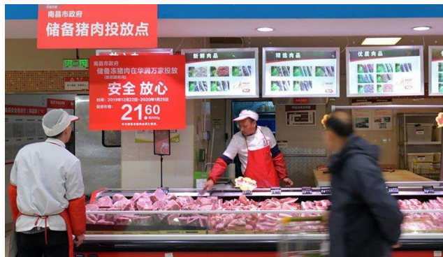
ដោយ ខេមបូឌូណូមីស

ប្រភព ៖ ខេមបូឌូណូមីស ចេញផ្សាយថ្ងៃទី១៤ ខែធ្នូ ឆ្នាំ២០២១។ ចិននឹងចាប់ផ្តើមអនុវត្តច្បាប់នាំចូលចំណីអាហារថ្មី នៅដើមឆ្នាំក្រោយ(អាមេរិក និងអឺរ៉ុបបារម្ភថា ខ្លាចដល់ខ្សែសង្វាក់ផ្គត់ផ្គង់)