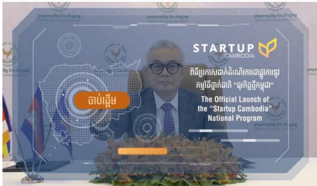
ដោយ ខេមបូណូមីស

ជំងឺកូវីដ-១៩ មិនអាចបន្ទប់បង្អាក់សកម្មភាពប្រកប អាជីវកម្ម និងការធ្វើពាណិជ្ជកម្មផ្សេងរបស់ប្រជា ពលរដ្ឋ ក៏ដូចជាមិនអាចរារាំងដល់សកម្មភាពណាមួយ របស់រាជរដ្ឋាភិបាលដែរ ហើយបានធ្វើឱ្យមានការផ្លាស់ ប្តូរឥរិយាបថនៃការរស់នៅ និងធុរកិច្ច។ ក្រសួងសេដ្ឋ កិច្ច និងហិរញ្ញវត្ថុ បានប្រកាសដាក់ឱ្យដំណើរការកម្មវិធី ថ្នាក់ជាតិស្តីពី «ធុរកិច្ចថ្មីកម្ពុជា» ឬហៅថា Cambodia Startup ក្នុងគោលបំណងជួយលើកកម្ពស់ប្រព័ន្ធអេកូ ឡូស៊ីធុរកិច្ចថ្មី និងសហគ្រិនភាពនៅកម្ពុជា តាមរយៈ ការផ្តល់យន្តការ សម្របសម្រួលរវាងភាគីពាក់ព័ន្ធក្នុង ប្រព័ន្ធអេកូឡូស៊ីធុរកិច្ចថ្មី ឱ្យមានបរិស្ថានធ្វើធុរកិច្ចថ្មី មានភាពរស់រវើក និងមានលក្ខខណ្ឌអំណោយផល សម្រាប់ធុរកិច្ចថ្មីឱ្យជោគជ័យ ដើម្បីរួមចំណែកស្តារ សេដ្ឋកិច្ច ដែលរងផលប៉ះពាល់ដោយសារជំងឺកូវីដ-១៩ និងរួមចំណែកកសាងសេដ្ឋកិច្ចឌីជីថលកម្ពុជា។ ការ បង្កើត «ធុរកិច្ចថ្មី» ឬ Startup គឺជានិន្នាការសកលដែល បង្កើតឡើងដើម្បីឆ្លើយតបនឹងការរីកចម្រើននៃប្រព័ន្ធ