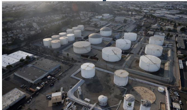
ដោយ ខេមបូណូមីស

តម្លៃប្រេងរំកិលឡើងបន្តិចទៀតហើយ ក្រោយដំណឹងថា អូមីក្រុង មិនធ្វើឱ្យមនុស្សធ្លាក់ខ្លួនឈឺធ្ងន់ធូរ