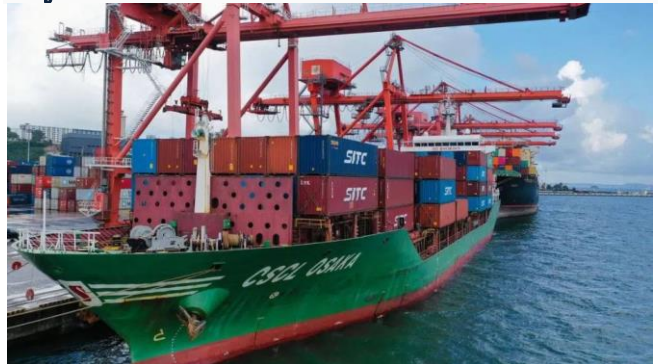
ដោយ ខេមបូឌូមីស (កំពង់ផែក្រុងព្រះសីហនុ)

ប្រភព ៖ ខេមបូឌូមីស ចេញផ្សាយថ្ងៃទី១៤ ខែធ្នូ ឆ្នាំ២០២១។ កម្ពុជានឹងបាត់បង់ភាពប្រកួតប្រជែង ប្រសិនបើការដឹក ជញ្ជូននៅតែថ្លៃជាងប្រទេសជំនិះ