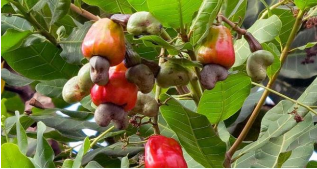
ដោយ ខេមបូណូមីស

ការនាំចេញកសិផលកម្ពុជានៅជិតពេញមួយឆ្នាំ ២០២១នេះ សម្រេចបានកំណើនខ្ពស់គួរឱ្យកត់សម្គាល់។ ក្នុងនោះដែរ ដំណាំគ្រាប់ស្វាយចន្ទីមានសក្តានុពល ខ្ពស់ក្នុងការនាំចេញនៅ១១ខែដំបូងឆ្នាំ២០២១នេះ បើ ធៀបជាទឹកប្រាក់នៃការនាំចេញស្រូវអង្ករ ឃើញថាទឹក ប្រាក់គ្រាប់ស្វាយចន្ទីមានលើសដល់ទៅជាង៦០០ លានដុល្លារអាមេរិក។