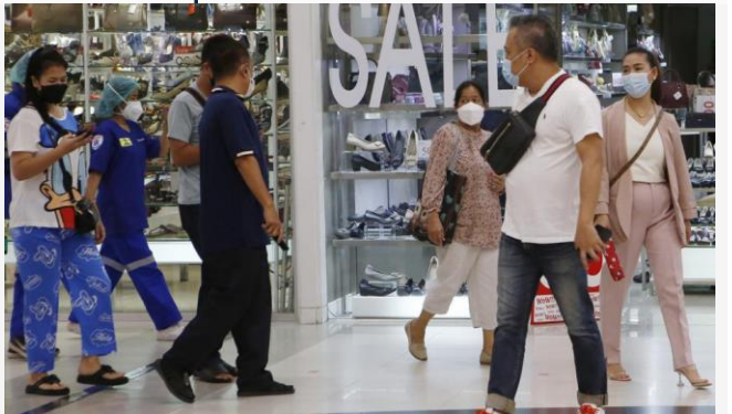
ដោយ ខេមបូណូមីស(រូបតំណាង: អតិផរណាថៃ)

អត្រាអតិផរណារបស់ប្រទេសថៃ នឹងមានរហូតដល់ ៣% នៅឆ្នាំ២០២២ ដែលជាកម្រិតខ្ពស់បំផុតមួយមិនធ្លាប់មានពីមុនមក ក្នុងរយៈពេល១ទសវត្សរ៍ចុងក្រោយនេះ។