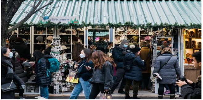
តម្រូវការរបស់អ្នកប្រើប្រាស់ក្នុងផ្សារស្វែមកាល Manhattan អាចនឹងធ្លាក់ចុះដោយសារតែកូវីដបំប្លែងថ្មី Omicron។

ទោះជាយ៉ាងណា ការព្យាករណ៍សម្រាប់ឆ្នាំ ២០២២ មានភាពមិនប្រាកដប្រជាខ្លាំង។ ដោយ វង្ស ច័ន្ទស្នីដារា ប្រភព៖ Reuters ចេញផ្សាយថ្ងៃទី៣០ ខែវិច្ឆិកា ឆ្នាំ២០២១ កូវីដបំប្លែងថ្មី Omicron គំរាមកំហែងសេដ្ឋកិច្ចអាមេរិក និងពិភពលោក