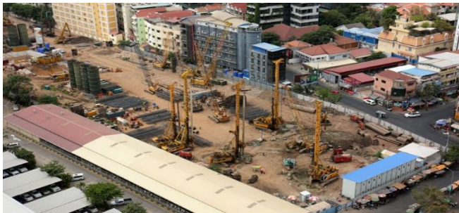
ប្រភព៖ khmertimes, ២០២១ រូបភាព៖ ជី សុគន្ធា

យោងតាមទិន្នន័យស្ថិតិរបស់ធនាគារជាតិនៃកម្ពុជា បានបញ្ជាក់ថា ប្រទេសកម្ពុជាបានទាក់ទាញការវិនិយោគផ្ទាល់ពីបរទេស (FDI) ចំនួន ៣៩ប៊ីលានដុល្លារ គិតត្រឹមឆមាសទី១ ឆ្នាំ២០២១ ដែលកើនឡើង ៩,៦% ធៀបនឹងរយៈពេលដូចគ្នានៃឆ្នាំមុន។