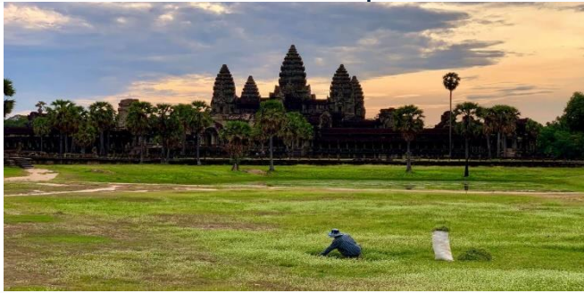
ដោយ ខេមបូឌូមីស

ការផ្ទុះការឆ្លងរាលដាលនៃជំងឺកូវីដ-១៩បំប្លែងថ្មី អូមីក្រុងនៅតំបន់អាហ្វ្រិក កំពុងបង្កក្តីបារម្ភថ្មីបន្ថែមទៀតដល់ពិភពលោក ស្របពេលមេរោគចាស់ៗនៅមិនទាន់ផុតរលត់ពីកំពង់ផែនដីនៅឡើយ។