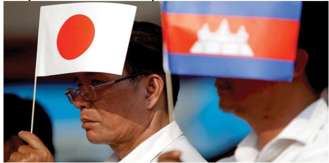
ដោយ ខេមបូឌូមីស

ការនាំចេញទំនិញរបស់កម្ពុជាទៅកាន់ទីផ្សារជប៉ុននៅ តែធ្វើបានល្អ នៅរយៈពេលជិត១ឆ្នាំកន្លងមកនេះ។ នៅ១០ខែក្នុងឆ្នាំ២០២១ កម្ពុជាសម្រេចបានទំហំនាំ ចេញទំនិញទៅជប៉ុនជាង៩២០លានដុល្លារ កើនឡើង ជាង ៥% បើធៀបនឹងរយៈពេលដូចគ្នាកាលពីឆ្នាំមុន ដែលមានទឹកប្រាក់ជាង ៨៧៤លានដុល្លារ។ ទំហំ ពាណិជ្ជកម្មទ្វេភាគីកម្ពុជា-ជប៉ុនកើនដល់ជាង១ពាន់៤ រយលានដុល្លារនៅ១០ខែឆ្នាំនេះ បន្ទាប់ពីជប៉ុនសម្រេច បានទំហំនាំចូលមកកម្ពុជាជិត៥រយលានដុល្លារអាមេរិក