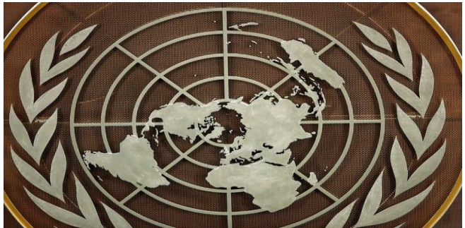
ផ្លាកសញ្ញា UN មុនពេលប្រមុខរដ្ឋបាលអន្តរជាតិសន្តិភាពនៅក្នុងសម័យប្រជុំលើកទី ៧៦ នៃមហាសន្និបាតអង្គការសន្តិភាពនៅទីក្រុងញ៉ូវយ៉ក សហរដ្ឋអាមេរិក ថ្ងៃទី ២១ ខែកញ្ញា ឆ្នាំ ២០២១

អង្គការសហប្រជាជាតិបាននិយាយថា ទស្សនៈវិស័យកំណើនពាណិជ្ជកម្មពិភពលោកឆ្នាំ២០២២ មានភាពមិនច្បាស់លាស់