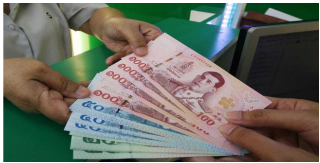
ប្រភព៖ AsiaNews ២០២១

ប្រភព៖freshnews រចនាផ្សាយថ្ងៃទី៣០ ខែវិច្ឆិកា ឆ្នាំ២០២១។ បំណុលប្រជាជនថៃ កើនដល់៨៩,៣% នៃផ.ស.ស