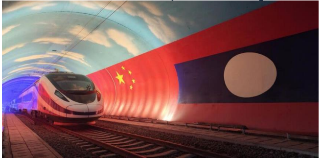
ដោយ ស្នើកម្ពុជា

ផ្លូវដែក ប្រវែង៤១៤គីឡូម៉ែត្រ បានចំណាយពេល ស្ថាបនា៥ឆ្នាំ ក្រោមគំនិតផ្តួចផ្តើមខ្សែក្រវាត់ និងផ្លូវ ដោយមូលនិធិរបស់ចិន តម្លៃ៦ពាន់លានដុល្លារ នឹង បើកអោយដំណើរការនៅដើមខែធ្នូ។ ពីមុនប្រទេសឡាវ មានផ្លូវថ្នល់តែ៤គីឡូម៉ែត្រ។ ប៉ុន្តែពេលនេះ រថភ្លើង ក្បាលគ្រាប់ពណ៌ក្រហមខៀវសដំរីលោង នឹងបង្ហាញ ខ្លួនលើផ្លូវថ្មី ក្នុងល្បឿន១៦០គីឡូម៉ែត្រក្នុង១ម៉ោង ឆ្លង កាត់ផ្លូវរូងក្រោមដី៧៥ ស្ពាន១៦៧ និងឈប់នៅ ស្ថានីយអ្នកដំណើរចំនួន១០។ ផ្លូវនេះ នាំក្តីសង្ឃឹមអំពី ការជំរុញសេដ្ឋកិច្ចនៅក្នុងប្រទេសក្រីក្រមិនមានជាប់ សមុទ្រមួយនេះ។