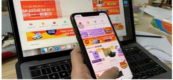
ដោយ ខេមបូឌូណូមីស(ការទិញតាមប្រព័ន្ធអេឡិចត្រូនិកនៅវៀតណាម)

ការប្រើប្រាស់ឌីជីថលនៅប្រទេសវៀតណាម បានក្លាយជាទម្លាប់ថ្មីមួយនៃការទិញ-លក់ទំនិញតាមអនឡាញ ហើយបានធ្វើឱ្យប្រទេសនេះក្លាយជាដើងឯកថ្មី នៅក្នុងទីផ្សារពាណិជ្ជកម្មតាមប្រព័ន្ធអេឡិចត្រូនិក E-commerce នៅតំបន់អាស៊ីអាគ្នេយ៍។ នៅក្នុងត្រីមាសទី៣នៅឆ្នាំ២០២១ ការទិញ-លក់ទំនិញតាមប្រព័ន្ធអេឡិចត្រូនិក E-commerce នៅប្រទេសវៀតណាមមានលើសប្រទេសថៃដល់ទៅទ្វេដង និងលើសប្រទេសម៉ាឡេស៊ីដល់ទៅ៣ដង ដែលបញ្ជាក់ឱ្យឃើញពីតម្រូវការទិញទំនិញតាមអនឡាញនៅវៀតណាម មានកំណើនខ្ពស់គួរឱ្យកត់សម្គាល់ នៅអំឡុងពេលនៃវិបត្តិជំងឺរាតត្បាតកូវីដ១៩នេះ។