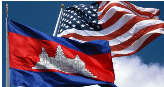
ដោយ ខេមបូណូមីស

នៅអំឡុង៩ខែដំបូងក្នុងឆ្នាំ២០២១ ការនាំចេញរបស់កម្ពុជាទៅសហរដ្ឋអាមេរិក សម្រេចបានជាង៥ពាន់លានដុល្លារ កើនឡើងជាង១០%បើធៀបនឹងរយៈពេលដូចគ្នាកាលពីឆ្នាំមុន។ ចំណែកការនាំចូលទំនិញ