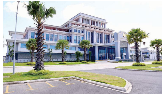
ធនាគារជាតិនៃកម្ពុជា