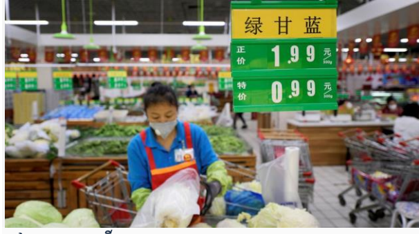
ដោយ ខេមបូណូមីស

ខេត្តសានតុង (Shandong) នៅភាគខាងជើងនៃ ប្រទេសចិន ជាខេត្តដាំដុះបន្លែបង្កាដ៏ធំរបស់ចិន។ នា ចុងខែកញ្ញានិងដើមខែតុលានេះ ភ្លៀងធ្លាក់ខ្លាំងខុសពី ធម្មតា ផលដំណាំត្រូវទឹកជន់លិចស្ទើរតែគ្មានអ្វីប្រមូល ផល បានធ្វើឱ្យតម្លៃបន្លែនៅក្នុងខេត្ត បានហាក់ឡើង ខ្លាំង រហូតថ្លៃជាងសាច់សត្វ ដូចជាសាច់ជ្រូកទៅទៀត។