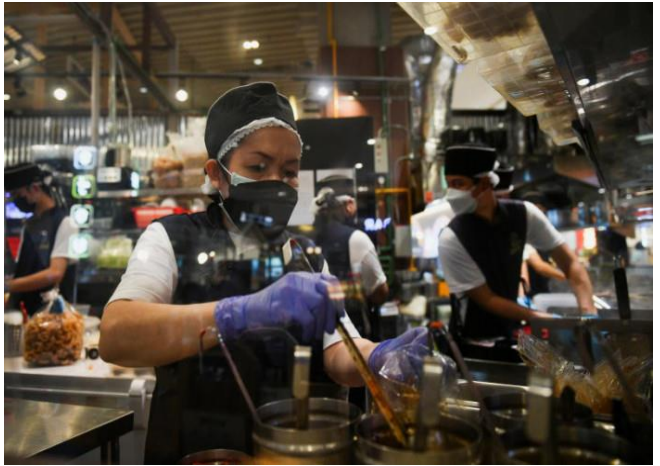
បុគ្គលិកកំពុងរៀបចំបើកភោជនីយដ្ឋានឡើងវិញនៅថ្ងៃទី០១ ខែវិច្ឆិកា ឆ្នាំ២០២១។

កំណើនសេដ្ឋកិច្ចរបស់ថៃធ្លាក់ចុះទាបជាងការរំពឹងទុក នៅក្នុងត្រីមាសទី៣ ក្នុងឆ្នាំ២០២១ នេះ ដោយសារតែ វិស័យពាណិជ្ជកម្មចាប់ផ្តើមមានសកម្មភាពឡើងវិញ ខណៈដែលវិស័យទេសចរណ៍រំពឹងថា នឹងល្អប្រសើរ ឡើងវិញ។ រដ្ឋាភិបាលថៃបានធ្វើបច្ចុប្បន្នភាពកំណើន សេដ្ឋកិច្ចរបស់ខ្លួនសម្រាប់ឆ្នាំនេះចំនួន ១,២% កើន