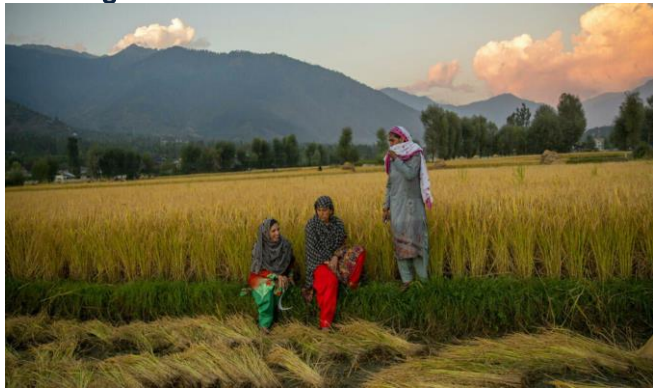
ដោយ ៖ rfi.fr

យោងតាមរបាយការណ៍របស់អង្គការស្បៀងអាហារ និងកសិកម្មពិភពលោក (FAO) នៅក្នុងខែតុលា កន្លងទៅតម្លៃស្បៀងអាហារ និងគ្រាប់ធញ្ញជាតិបាន បន្តឡើងថ្លៃខ្លាំងគួរឱ្យព្រួយបារម្ភ។ តម្លៃនេះ បានកើន ចំនួន៣% នៅក្នុងខែតុលា បើប្រៀបធៀបទៅនឹង ខែ កញ្ញា។ នៅក្នុងកំឡុងពេលមួយឆ្នាំ តម្លៃស្បៀងអាហារ បានឡើងចំនួន៣១,៣%។ តម្លៃស្បៀងអាហារ បាន