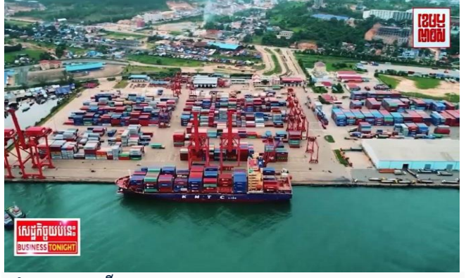
ដោយ ខេមបូឌូមីស

ប្រកប្រតិបត្តិការ ខេមបូឌូមីស ចេញផ្សាយថ្ងៃទី០៤ ខែវិច្ឆិកា ឆ្នាំ២០២១។ ការនាំចេញរបស់កម្ពុជាទៅថៃធ្លាក់ចុះ២៨% ខណៈនាំចូលពីថៃកើន ១៤% នៅខែឆ្នាំនេះ