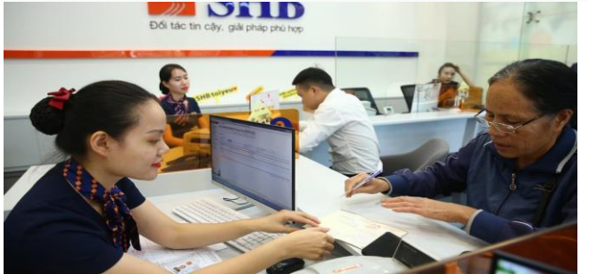
ដោយ ខេមបូឌូមីស

ធនាគារនៅរៀតណាមចំនួន១៦ បានកាត់បន្ថយអត្រាការប្រាក់ សម្រាប់អ្នកខ្ចីប្រាក់ ដែលរងផលប៉ះពាល់ដោយសារកូវីដ១៩ ចាប់តាំងពីពាក់កណ្តាលខែកក្កដារហូតដល់ដំណាច់ខែកញ្ញាកន្លងទៅនេះ។ នេះគឺជាការប្តេជ្ញាចិត្តជួយដល់ពលរដ្ឋ និងអាជីវកម្មដែលជំពាក់លុយធនាគារ គ្មានលទ្ធភាពសង។