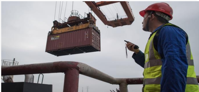
ដោយ ខេមបូឌូមីស(រូបតំណាង ៖ ការនាំចេញរបស់ចិន)

ការនាំចេញរបស់ចិន នៅបន្តរក្សាបានសញ្ញាវិជ្ជមាន ទោះស្ថិតក្នុងវិបត្តិខ្វះខាតថាមពល និងវិបត្តិកូវីដ១៩ ដែលកំពុងកម្រើកឡើងវិញយ៉ាងណាក្តី។ ក្នុងខែតុលា កន្លងទៅ ការនាំចេញរបស់ចិន មានទំហំទឹកប្រាក់សរុប ជាង ៣០០ពាន់លានដុល្លារអាមេរិក កើន២៧% បើ ធៀបនឹងខែតុលាឆ្នាំ២០២០។ រីឯការនាំចូលមកវិញ មានទឹកប្រាក់ជាង ២១៥ពាន់លានដុល្លារ កើនជិត ២១%។ ការនាំចេញ និងនាំចូលនេះ មានកំរិតខ្ពស់ ជាងកាលពីឆ្នាំមុន។