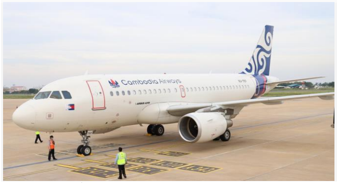
ដោយ ខេមបូឌូមីស(ព្រលានយន្តហោះអន្តរជាតិភ្នំពេញ)

ក្រោយពេលមានការប្រកាសពីសំណាក់រាជរដ្ឋាភិបាល កម្ពុជា ឱ្យមានការបើកប្រទេសឡើងវិញ និងការត្រៀម ខ្លួនទទួលភ្ញៀវទេសចរចាក់វ៉ាក់សាំងរួច ចាប់ពីចុងខែវិច្ឆិ កា តទៅនោះ គេសង្កេតឃើញ ក្រុមហ៊ុនអាកាសចរណ៍ ជាច្រើន ចាប់ផ្តើមស្ទុះស្ទាបៀបចំខ្លួនក្នុងការបើក ប្រតិបត្តិការដឹកភ្ញៀវទេសចរអន្តរជាតិឡើងវិញ។ ប៉ុន្តែ អ្វីដែលគួរឱ្យចាប់អារម្មណ៍នោះ គឺតម្លៃសំបុត្រយន្ត ហោះប្រទេសកម្ពុជា និងចិន កំពុងឡើងថ្លៃខ្លាំង ខណៈ ដែលថ្លៃសំបុត្រយន្តហោះទៅកាន់ទិសដៅប្រទេស ផ្សេងៗទៀត នឹងឡើងថ្លៃតិចតួច។ បច្ចុប្បន្នតម្លៃសំបុត្រ យន្តហោះកម្ពុជា-ចិន តែ១ដើង ចេញពីកម្ពុជាទៅចិន ឬពីចិនមកកម្ពុជា មានតម្លៃរហូត ៥ពាន់-១ម៉ឺនដុល្លារឯ ណោះ ដែលកាលពីមុន ការធ្វើដំណើរ១ដើងតម្លៃ សំបុត្រ ត្រឹមតែ៤០០ ទៅ៥០០ដុល្លារប៉ុណ្ណោះ ឬអាច ក្រោមនេះក៏មានដែរ។