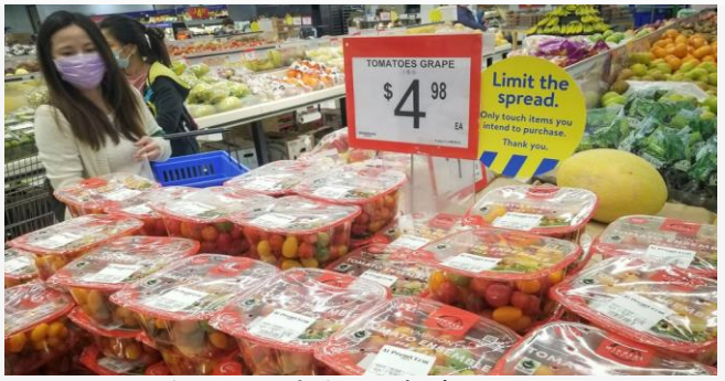
ដោយ ខេមបូណូមីស (ក្នុងផ្សារទំនើបមួយកន្លែងនៃប្រទេសកាណាដា)