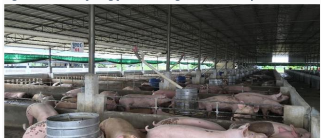
ដោយ ខេមបូឌូមីស (កសិដ្ឋានចិញ្ចឹមជ្រូករបស់កសិករក្នុងស្រុកមួយកន្លែង)

បច្ចុប្បន្ន តម្លៃជ្រូករស់នៅកម្ពុជាបានប្រសើរឡើងវិញបន្តិច បើធៀបនឹងអំឡុងពិធីបុណ្យភ្ជុំបិណ្ឌកន្លងមក ដែលអាចលក់បានក្នុងតម្លៃ ១ម៉ឺនរៀល ក្នុងមួយគីឡូក្រាមខណៈកាលពីអំឡុងពិធីបុណ្យភ្ជុំបិណ្ឌជ្រូករស់ក្នុងស្រុកអាចលក់បានត្រឹម៩ពាន់រៀលមួយគីឡូក្រាម។ សមាគមអ្នកចិញ្ចឹមសត្វនៅកម្ពុជាអះអាងថា ស្ថានភាពទីផ្សារ និងការចិញ្ចឹមជ្រូក ចាប់ផ្តើមល្អឡើងវិញជាបណ្តើរៗហើយ ដោយសារតម្លៃជ្រូករស់ក្នុងស្រុកកាន់តែប្រសើរ។ ការប្រែប្រួលនៃតម្លៃជ្រូករស់ក្នុងស្រុក ដោយសារតែ