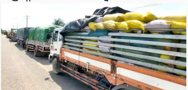
ដោយ ខេមបូឌូមីស

ទឹកប្រាក់នាំចេញអង្ករ និងស្រូវរបស់កម្ពុជាបូកបញ្ចូលគ្នានៅ១០ខែឆ្នាំ២០២១នេះ សម្រេចបានដល់ទៅ ជិត៩៦០លានដុល្លារអាមេរិក ដោយក្នុងនោះ ទឹកប្រាក់ដែលបានមកពីការនាំចេញស្រូវ មានដល់ប្រមាណ ៦៣៣លានដុល្លារ លើសការនាំចេញអង្ករដល់ទៅជិត២ដង។ បើមើលទៅលើបរិមាណនាំចេញវិញ ឃើញថាការនាំចេញស្រូវបានជាង២លាន៦សែនតោន កើន