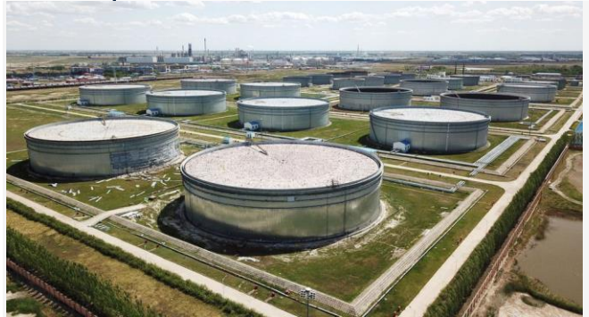
(រូបតំណាង៖ ក្រុមហ៊ុនចម្រាញ់ប្រេងធំរបស់រដ្ឋចិន)