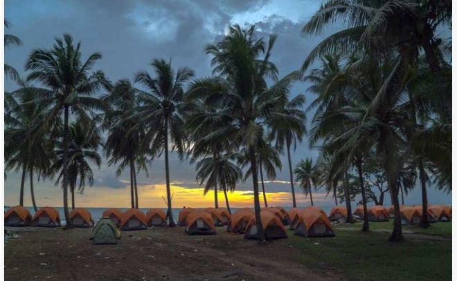
ដោយ ខេមបូណ្ណមីស (ខេត្តកោះកុង)

ប្រភព៖ Khmer Times ចុះថ្ងៃទី០៩ ខែវិច្ឆិកា ឆ្នាំ២០២១ វិស័យសេវាកម្មកម្ពុជា នឹងកើនយឺតនៅឆ្នាំ ២០២២