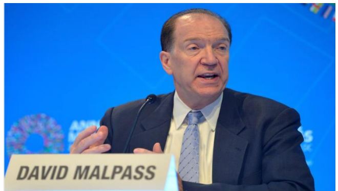
ប្រភព៖ Reuters ២០២១, រូបភាព៖ Mike Theiler/Files

បំណុលរបស់ប្រទេសក្រីក្រកើនឡើង ១២% ស្មើនឹង ៨៦០ប៊ីលានដុល្លារអាមេរិកនៅក្នុងឆ្នាំ២០២០ យោង តាមធនាគារពិភពលោក