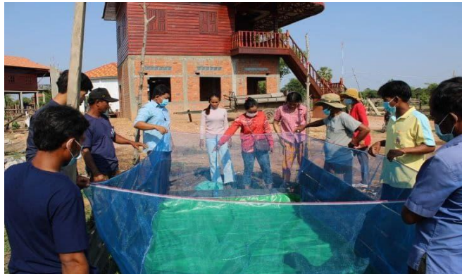
ដោយ វិទ្យុជាតិកម្ពុជា

ប្រជាពលរដ្ឋក្រីក្រ១ ក្រីក្រ២ និងបងប្អូនដែលត្រឡប់ពីចំណាកស្រុក មិនមានការងារធ្វើ ប្រមាណ ៩០០គ្រួសារ ទទួលបានពូជមាន់ ត្រី និងកង្កែប សម្រាប់ចិញ្ចឹមជា