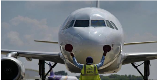
រូបភាព៖ រៀនបុក អាកាសយានដ្ឋាន

ខណៈដែលយុទ្ធនាការចាក់វ៉ាក់សាំងកូវីដ-១៩ ជូនប្រជាពលរដ្ឋចាប់ពីអាយុ១៨ឆ្នាំឡើងទៅសម្រេចបានជិត១០០% បានផ្តល់ក្តីសង្ឃឹមសម្រាប់កម្ពុជា ក្នុងការឈានទៅបើកសកម្មភាពសេដ្ឋកិច្ច និងសង្គមទាំងស្រុងក្នុងរយៈពេលដ៏ខ្លីខាងមុខ។