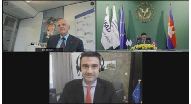
ដោយ ខេមបូឌូមីស

សហភាពអឺរ៉ុប គ្រោងផ្តល់ជំនួយឥតសំណងជាង ១៧ លានដុល្លារ ដើម្បីអភិវឌ្ឍវិស័យកសិកម្មកម្ពុជា