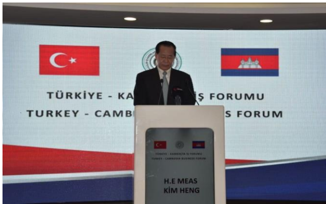
ប្រភព ៖ CEN

ស្ថានឯកអគ្គរាជទូតកម្ពុជាប្រចាំប្រទេសតួកគី និងក្រុមការងារសម្របសម្រួលការទូតសេដ្ឋកិច្ច ដោយសហការជាមួយសភាពាណិជ្ជកម្មកម្ពុជា និងសហព័ន្ធអ្នកជំនួញឧស្សាហកម្មតួកគី SANKON បានរៀបចំ “ជំនួបធុរកិច្ចរវាងកម្ពុជា-តួកគី” ដើម្បីពង្រឹងកិច្ចសហប្រតិបត្តិការ និងតភ្ជាប់ទំនាក់ទំនង រវាងវិនិយោគិន និងធុរជនកម្ពុជា និងតួកគី។