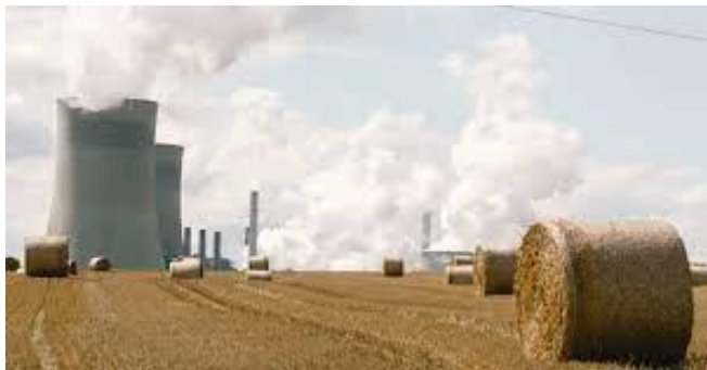
ប្រភព៖ CNBC ២០២១, រូបភាព៖ Ying Tang

ខណៈពេលដែលប្រទេសជាច្រើនក្នុងអឺរ៉ុប ព្យាយាមរក វិធីដោះស្រាយជាមួយនឹងវិបត្តិវិស័យថាមពលដែលមិន ធ្លាប់មានពីមុន ឧស្សាហកម្មថាមពលចក្រភពអង់គ្លេស អាចនឹងតម្រង់ទៅរកការរៀបចំចាត់ចែងវិស័យនេះសារ ឡើងវិញ។