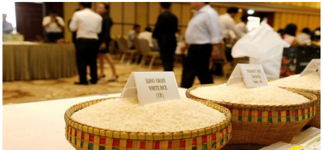
ដោយ ខេមបូឌូមីស

ក្រោយជួបបញ្ហាក្នុងការនាំចេញអង្ករទៅកាន់ប្រទេស ឆ្ងាយៗជាពិសេសទីផ្សារអឺរ៉ុប ដោយសារបញ្ហាកង្វះទុក្ខ កុងតឺន័រ និងតម្លៃដឹកជញ្ជូនឡើងថ្លៃខ្ពស់ បច្ចុប្បន្ន កម្ពុជាកំពុងយកចិត្តទុកដាក់ងាកទៅរកទីផ្សារចិន ដែលកំពុងមានតម្រូវការអង្ករប្រណីតកើនឡើង បើធៀប នឹងបណ្តាប្រទេសផ្សេងៗ។