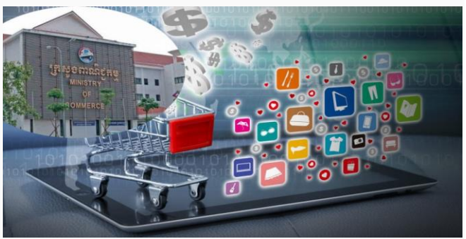
ដោយ ខេមបូឌីស

ក្រសួងពាណិជ្ជកម្មកម្ពុជា បានសង្កេតឃើញក្រុមហ៊ុន សហគ្រាស និងអាជីវករតាមប្រព័ន្ធអនឡាញ (Online) មួយ ចំនួនធំ កំពុងប្រតិបត្តិការដោយគ្មានលិខិត ឬអាជ្ញា បណ្ណអនុញ្ញាត។ ក្រសួងបានកំណត់ឱសានវាទឱ្យក្រុម ហ៊ុន សហគ្រាស និងបុគ្គលរកស៊ីតាមប្រព័ន្ធអនឡាញទាំង នោះ មកដាក់ពាក្យស្នើសុំលិខិត ឬអាជ្ញាបណ្ណតាម ប្រព័ន្ធអេឡិចត្រូនិកឱ្យបានមុនថ្ងៃទី១ ខែធ្នូ ឆ្នាំ ២០២១។ ក្រសួង ក៏ព្រមានពិន័យជាប្រាក់ ឬផ្អាកអាជីវ កម្មណាដែលបន្តអាជីវកម្មដោយគ្មានលិខិត ឬអាជ្ញា