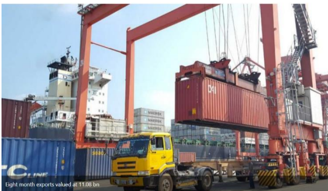
Eight month exports valued at 11.08 bn

ការនាំចេញកម្ពុជា សម្រេចបានក្នុងទំហំទឹកប្រាក់ចំនួន ១១,០៨ប៊ីលានដុល្លារអាមេរិក ក្នុងរយៈពេល ០៨ខែដំបូង នៃឆ្នាំ២០២១។ គួរលេខនេះ គឺធ្លាក់ចុះ ៥,៣% ធៀបនឹងរយៈពេលដូចគ្នាកាលពីឆ្នាំមុន នេះបើយោងតាមរបាយការណ៍ផ្លូវការដែលចេញផ្សាយដោយក្រសួងពាណិជ្ជកម្មកម្ពុជា។