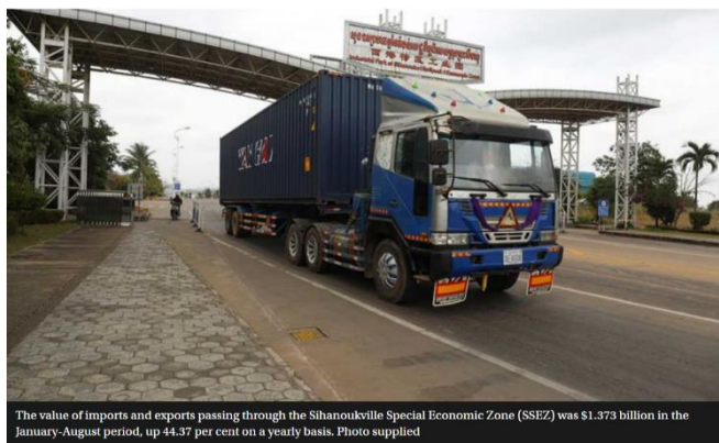
The value of imports and exports passing through the Sihanouville Special Economic Zone (SSEZ) was $1.373 billion in the January-August period, up 44.37 per cent on a yearly basis.