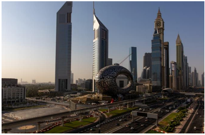
ប្រភព៖ CNBC ២០២១, រូបភាព៖ Christopher Pike | Bloomberg

គម្រោង និងការផ្តួចផ្តើមថ្មី ចំនួន៥០ របស់សហព័ន្ធអារ៉ាប់រួម នឹងត្រូវប្រកាសនៅប៉ុន្មានសប្តាហ៍ខាងមុខនេះ ចំពេលពិធីបុណ្យខួបលើកទី៥០ បើយោងតាមមន្ត្រី