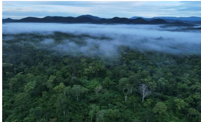
By Pen Srey Neat