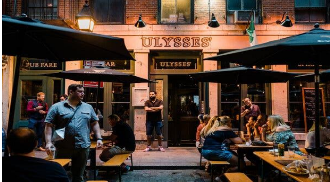
ប្រភព៖ The New York Times ២០២១

ការពន្យារបន្ថែមនៃគម្រោងអត្ថប្រយោជន៍សម្រាប់អ្នក គ្មានការងារធ្វើ ក្នុងសហរដ្ឋអាមេរិក បានឈានដល់កាល កំណត់ថ្មីៗនេះ។ គម្រោងនេះ បានជួយគាំទ្រដល់ប្រជា ពលរដ្ឋអាមេរិករាប់លាននាក់ ដែលមិនមានការងារធ្វើ ក្នុងកំឡុងវិបត្តិជំងឺកូវីដ-១៩ ដើម្បីមានលទ្ធភាពក្នុងការ ផ្គត់ផ្គង់ជីវភាព។ គួរបញ្ជាក់ថា លោកប្រធានាធិបតី Biden និងក្រុមទីប្រឹក្សាសេដ្ឋកិច្ចរបស់លោក មិនមាន ការជំទាស់ទៅលើការបញ្ចប់នៃគម្រោងនេះឡើយ (គម្រោងនេះ បានផ្តល់ជំនួយគាំទ្រទៅដល់ប្រជាជន ប្រមាណ ៧,៥លាននាក់)។