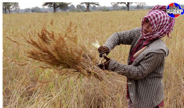
កសិករកំពុងប្រមូលផលស្រូវ