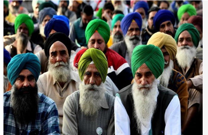
ដោយ រុក្ខ ច័ន្ទតារា

សេដ្ឋកិច្ចឥណ្ឌាកាលពីត្រីមាសទី២ឆ្នាំ២០២១នេះ បានហាក់ឡើងក្នុងអត្រា២០% ទោះបីជា បានរងគ្រោះយ៉ាងដំណំពីរលកឆ្លងកូវីដ១៩ ដ៏កាចសាហាវ ប៉ះពាល់ទាំងសេដ្ឋកិច្ច និងសុខភាពសាធារណៈក្តី។ កំណើននេះបានមកពីការជួយរុញច្រានដោយយុទ្ធនាការចាក់វ៉ាក់សាំងបានចំនួនច្រើនទៅៗ ដែលធ្វើឱ្យគេអាចឈានទៅគ្រប់គ្រងលើការឆ្លងរាលដាលកូវីដ១៩ ហើយ