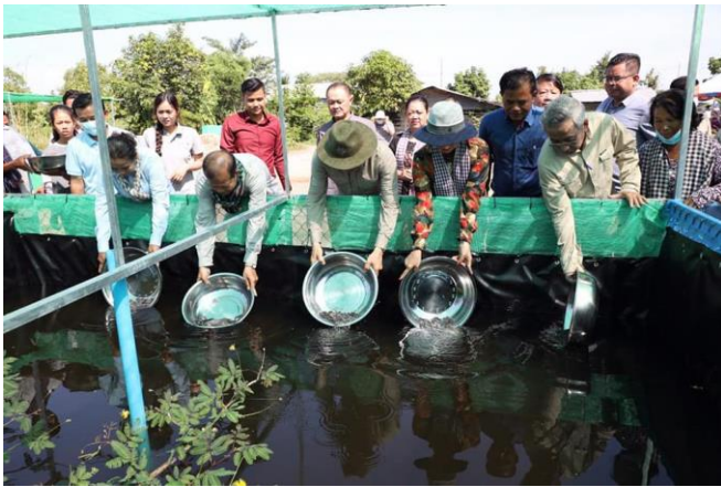
ដោយ sopheak khoun

រដ្ឋមន្ត្រីក្រសួងកសិកម្ម រុក្ខាប្រមាញ់ និងនេសាទ បានណែនាំដល់ប្រជាកសិករ ចិញ្ចឹមត្រី អណ្តែង និងកង្កែប ត្រូវសហការរួមគ្នាចងក្រងទៅជាបណ្តុំអាជីវកម្ម ឱ្យបានច្រើន ដើម្បីលើកកម្ពស់ទីផ្សារផលិតកម្មវារីវប្បកម្ម ឱ្យកាន់តែប្រសើរឡើង។ ការចងក្រងជាបណ្តុំអាជីវកម្ម ធ្វើឡើងដើម្បីជាកម្លាំងចលករផលិត កែច្នៃ ទីផ្សារ ទទួលបានព័ត៌មាន តម្លៃបន្ថែម ទទួលបានបច្ចេកទេស បង្កើតជាសំឡេងតវ៉ា អំពីផលប្រយោជន៍ផ្សេងៗ និងរួមគ្នាដោះស្រាយបញ្ហា។