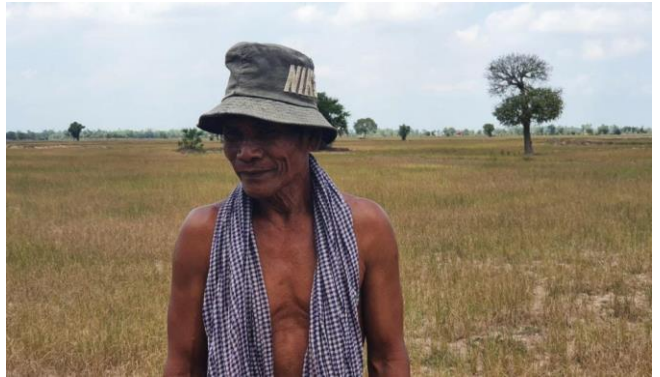
ដោយ Sokhom Khon

ស្រូវវិស្សាជាច្រើនហិកតា នៅក្នុងស្រុកក្រឡាញ់ ខេត្ត សៀមរាប បានក្រៀមស្វិត និងប្រឈមដាប់ ខណៈ ដែលស្រូវនោះ ខ្វះទឹកភ្លៀងស្រោចស្រប់ និងមិនមាន ប្រភពទឹកបញ្ចូលស្រែ។