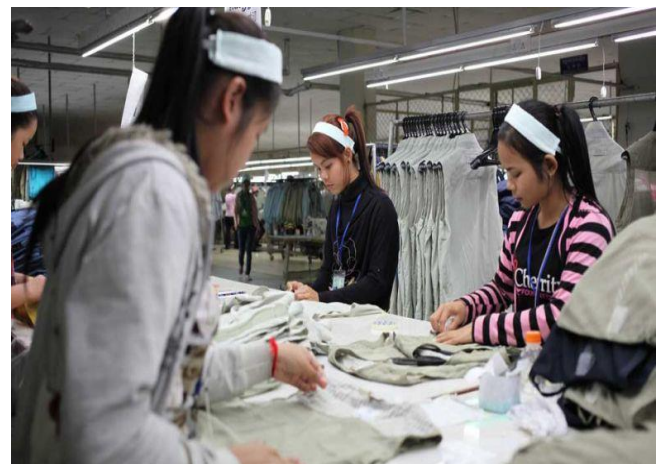
រូបថត ៖ ហេង ជីវ៉ាន