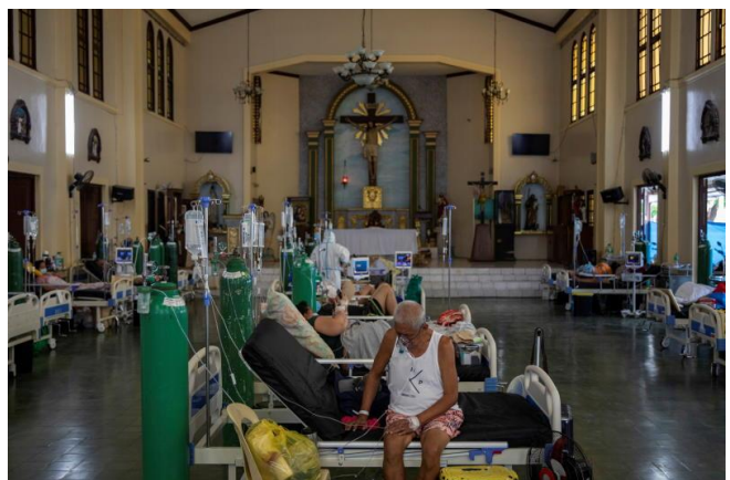
អ្នកជំងឺកូវីដនៅទីក្រុង Quezon ប្រទេសហ្វីលីពីន ថ្ងៃទី២០ ខែសីហា ឆ្នាំ២០២១។

កំណើននៃការរីករាលដាលកូវីដ១៩ Delta មានការកើនឡើងយ៉ាងគំហុក ខណៈដែលចំនួនអ្នកចាក់វ៉ាក់សាំង