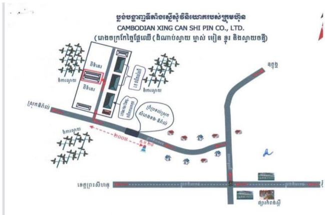
ដោយ Dy Bunnara

ក្រុមប្រឹក្សាអភិវឌ្ឍកម្ពុជា បានអនុញ្ញាតឱ្យមានរោង ចក្រកែច្នៃផ្លែឈើនៅខេត្តកំពង់ស្ពឺ ដោយបានសម្រេច ចេញវិញ្ញាបនបត្រចុះបញ្ជីជាស្ថាពរ ជូនដល់ក្រុមហ៊ុន CAMBODIAN XING CAN SHI PIN CO., LTD. L លើ គម្រោងបង្កើតរោងចក្រកែច្នៃផ្លែឈើ (ដំណាប់ស្វាយ, ម្នាស់, មៀន, ខ្នុរ និងស្វាយចន្ទី) ដែលមានទីតាំងវិនិយោគ ស្ថិតនៅភូមិតាំងស្រឹង ឃុំសង្កែសាទប ស្រុកឱរ៉ាល់ ខេត្ត កំពង់ស្ពឺ មានទុនវិនិយោគប្រមាណ ១១,២លានដុល្លារ អាមេរិក និងអាចបង្កើតការងារបានចំនួន ១៥៤នាក់។ នៅក្នុងនោះដែរ គណៈកម្មាធិការវិនិយោគកម្ពុជានៃក្រុម ប្រឹក្សាអភិវឌ្ឍន៍កម្ពុជា បានសម្រេចចេញវិញ្ញាបនបត្រ ចុះបញ្ជីជាស្ថាពរជូនក្រុមហ៊ុនជាច្រើនទៀត មានដូចជា៖ ១. ETHAN METAL MANUFACTURE CO., LTD. គម្រោងបង្កើតរោងចក្រកែច្នៃអាឡុយមីញ៉ូម ដែក និង