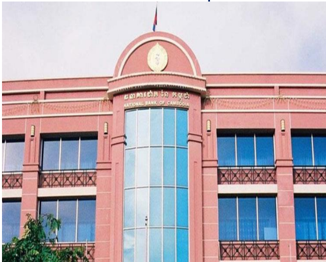
ប្រភព៖ Khmer Times ២០២១, រូបភាព៖ ធនាគារជាតិនៃកម្ពុជា

អគ្គទេសាភិបាលនៃធនាគារជាតិនៃកម្ពុជា ឯកឧត្តម ជា ចាន់តូ បានលើកឡើងថា ការងើបឡើងវិញនៃសេដ្ឋកិច្ចពិភពលោក នឹងអាចជួយគាំទ្រដល់វិស័យនាំចេញ និងវិនិយោគកម្ពុជា ដែលនឹងជំរុញសេដ្ឋកិច្ចកម្ពុជាឱ្យមានកំណើនវិជ្ជមាន ក៏ដូចជា ជំរុញការងើបឡើងវិញនៃវិស័យទេសចរណ៍។