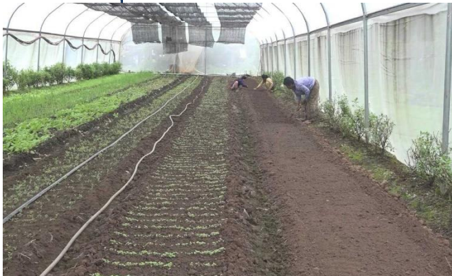
អគ្គបទដ្ឋាន ប៉េស សារី

អ៊ីស្រៃ រឺ សុផល ជាកសិករនៅភូមិប៉ាតាងតា ឃុំប៉ាតាង ស្រុកលំផាត់ ខេត្តរតនគិរី ដែលប្រកបរបរដាំបន្លែគ្រប់មុខ ជិត១០ឆ្នាំមកហើយនោះ កំពុងតែសប្បាយចិត្តក្នុងការ លក់បន្លែបានថ្លៃខ្ពស់ជាងឆ្នាំមុន។ ឆ្នាំនេះបន្លែដែលមាន ទីផ្សារខ្លាំងជាងគេគឺ បន្លែសណ្តែកក្បូរ និងបន្លែស្ពៃ។ បច្ចុប្បន្ន គាត់កំពុងជួលដីគេថែមទៀត ដើម្បីដាំបន្លែ វិលជុំសម្រាប់លក់។ ក្រៅពីដាំបន្លែ គាត់មានចិញ្ចឹមមាន់ ទា ដាំដំណាំហូបផ្លែ និងចិញ្ចឹមគោជិត២០ក្បាល សម្រាប់យកលាមកគោធ្វើដីដាក់ដំណាំ និងធ្វើស្រែ វស្សាសម្រាប់ផ្គត់ផ្គង់ជីវភាពបន្ថែមទៀត។