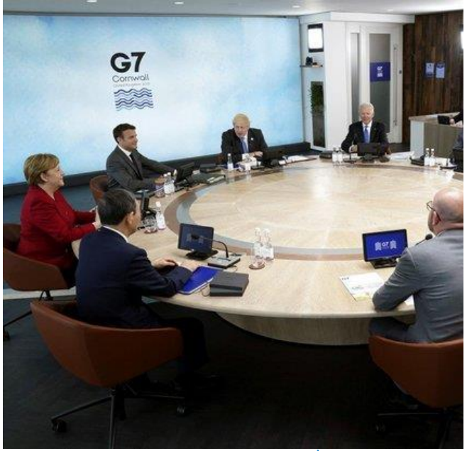
កាលពីខែមិថុនាក្រុមប្រទេស G-7 បានចុះកិច្ចព្រមព្រៀងយកពន្ធអប្បបរមា ១៥% ចំណែកឯរដ្ឋមន្ត្រីត្រូវស្ទង់សេដ្ឋកិច្ចទាំង២០ បានគាំទ្រដល់គម្រោងនេះនៅខែកក្កដា។

របបពន្ធអន្តរជាតិថ្មីត្រូវបានបង្កើតឡើង ដើម្បីជំរុញ ដល់ការអនុវត្តគោលនយោបាយសារពើពន្ធនៅតាមបណ្តា ប្រទេសដែលទទួលរងផលប៉ះពាល់ខ្លាំងដោយសារ វិបត្តិកូវីដ១៩។ ពន្ធសាជីវកម្មអប្បបរមាសកល ត្រូវបានកំណត់យកត្រឹមអត្រា ១៥% និងត្រូវបានបង្កើត ឡើងដោយកិច្ចព្រមព្រៀងអន្តរជាតិរវាងរដ្ឋមន្ត្រីហិរញ្ញវត្ថុ នៃក្រុមប្រទេសចំនួន ២០ (G20) ដើម្បីរៀបចំឡើងវិញ នូវលំហូរវិនិយោគអន្តរជាតិ ដែលបង្កើតឱ្យមានភាពមិន ប្រាកដប្រជាដល់ប្រជាជាតិអាស៊ីអាគ្នេយ៍ ដែលកំពុងតែ ប្រឹងប្រែង ទាក់ទាញមូលធន និងជំនាញហិរញ្ញវត្ថុពីបរ ទេស។ គួរបញ្ជាក់ផងដែរថា ប្រទេស G7 ស្នើឱ្យកំណត់ ពន្ធសាជីវកម្មអប្បបរមានៅលើពិភពលោកក្នុងអត្រា១៥% ដែលត្រូវបានសម្រេចជ្រើសរើស តាមរយៈការ សម្រុះសម្រួលរវាងអត្រាពន្ធ ២១%នៅសហរដ្ឋអាមេរិក