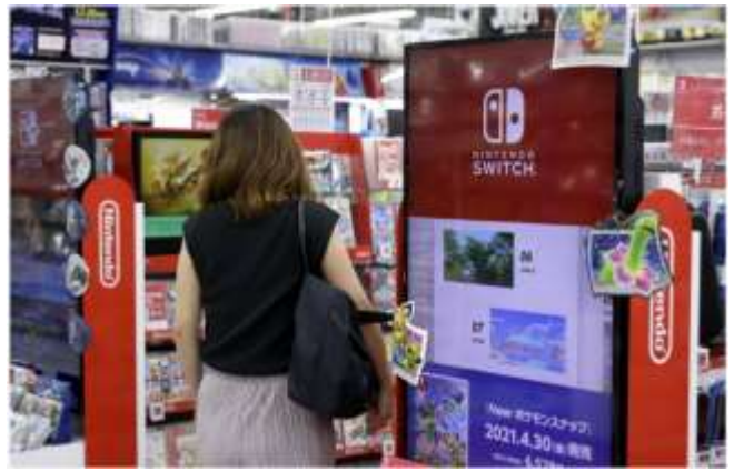
ប្រភព៖ The Japan Times ២០២១

ការអូសបន្លាយពេល នៃវិបត្តិកង្វះវត្ថុធាតុដើម ឧបករណ៍អគ្គិសនី (semiconductors) នៅទូទាំង ពិភពលោក កំពុងចាប់ផ្តើមផ្តល់ផលប៉ះពាល់ដល់ក្រុមហ៊ុន ផលិតសម្ភារៈប្រើប្រាស់ក្នុងផ្ទះ និងគ្រឿងអេឡិចត្រូនិច នៅក្នុងប្រទេសជប៉ុន។ ជាក់ស្តែង កង្វះវត្ថុធាតុដើម ឧបករណ៍អគ្គិសនី បានបណ្តាលឱ្យមានការពន្យារពេល ក្នុងការចែកចាយរថយន្ត។