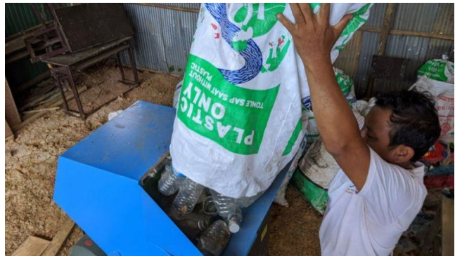
ប្រភព៖ ភ្នំពេញប៉ុស្ដិ៍ ២០២១, រូបភាព៖ សហការី

រាជរដ្ឋាភិបាលកម្ពុជា ដោយមានការគាំទ្រពីដៃគូអភិវឌ្ឍន៍នានា បានដាក់ឱ្យដំណើរការផែនការសកម្មភាពជាតិសេដ្ឋកិច្ចវិលជុំ និងនីតិវិធីដើម្បីជំរុញការចូលរួមពីវិស័យឯកជន ក្នុងអន្តរកាលឆ្ពោះទៅរកសេដ្ឋកិច្ចវិលជុំ ខណៈដែលកំណើនសេដ្ឋកិច្ច និងកំណើនប្រជាជននៅកម្ពុជាបាននាំមកនូវបញ្ហាប្រឈមថ្មីៗក្នុងការគ្រប់គ្រងធនធានជាតិបរិស្ថាន ថាមពល និងសំណល់ប្រកបដោយនិរន្តរភាព។ ឯកឧត្តម សាយ សំអាល់ រដ្ឋមន្ត្រីក្រសួងបរិស្ថាន និងជាប្រធានក្រុមប្រឹក្សាជាតិអភិវឌ្ឍន៍ដោយចីរភាព (NCSD)