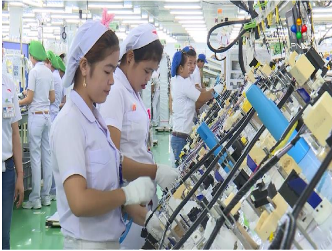
ប្រភព. ព័ត៌មាន PNN ២០២១ និស្សមភាពឯកសារ

ក្នុងរយៈពេល ៥ខែ ដើមឆ្នាំ២០២១នេះ ប្រទេសកម្ពុជាសម្រេចបាននូវការនាំចេញទំនិញ ក្នុងទំហំទឹកប្រាក់ប្រមាណ១៤០លានដុល្លារអាមេរិក ទៅកាន់ប្រទេសកូរ៉េខាងត្បូង កើនឡើង០,៤% ធៀបនឹងរយៈពេលដូចគ្នាកាលពីឆ្នាំមុន។ គិតចាប់ពីខែមករា ដល់ខែមេសា ការនាំចេញទំនិញពីកម្ពុជា ទៅកាន់ទីផ្សារកូរ៉េ រក្សាកំណើនវិជ្ជមាន ទើបតែក្នុងខែឧសភា ការនាំចេញរបស់កម្ពុជាបានធ្លាក់ចុះដល់ទៅ៤១% ធៀបនឹងពេលដូចគ្នាកាលពីឆ្នាំមុន។