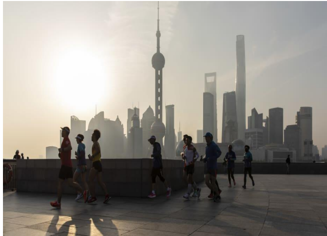
ប្រជាពលរដ្ឋចិនកំពុងតែរត់ហាត់ប្រាណានៅសៀងហៃ ថ្ងៃទី១០ ខែមេសា ឆ្នាំ២០២១

ក្នុងអំឡុងពេលមួយទសវត្សរ៍ចុងក្រោយនេះ បំណុលរបស់ចិនមានការកើនឡើងយ៉ាងគំហុក។ ទីក្រុងប៉េកាំងបានធ្វើការកត់សំគាល់ថា កំណើននៃបំណុលគឺជាការគម្រាមកំហែង ដល់ស្ថិរភាពសេដ្ឋកិច្ចរបស់ចិន។ ប៉ុន្មានឆ្នាំនេះ ចិនបានព្យាយាមកាត់បន្ថយការពឹងផ្អែកលើបំណុលដើម្បីជំរុញកំណើនសេដ្ឋកិច្ច។ ប៉ុន្តែកិច្ចខិតខំប្រឹងប្រែងនេះ ត្រូវបានរាំងស្ទះដោយសារតែកូវីដ១៩។