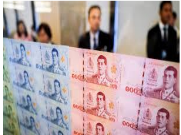
ប្រភព៖ CTN News ២០២១

ធនាគារកណ្តាលថៃ បានលើកឡើងពីការងើបឡើង យឺតនៃវិស័យទេសចរណ៍ បង្កមកពីការកើនឡើងនៃការ រាលដាលជំងឺកូវីដ-១៩ និងបានរំពឹងថា សេដ្ឋកិច្ចនឹង អាចវិលត្រលប់ទៅរកកម្រិតមុនវិបត្តិវិញ នៅត្រីមាសទី១ ឆ្នាំ២០២៣។