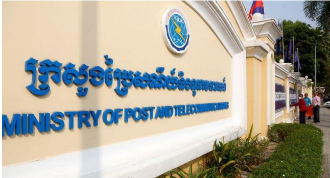
ក្រសួងប្រៃសណីយ៍ និងទូរគមនាគមន៍។

រាជរដ្ឋាភិបាលកម្ពុជា បានដាក់ចេញនូវក្របខ័ណ្ឌគោលនយោបាយសេដ្ឋកិច្ច និងសង្គមឌីជីថលកម្ពុជា ឆ្នាំ២០២១-២០៣៥ ដើម្បីកសាងសេដ្ឋកិច្ចឌីជីថលឱ្យក្លាយជាចន្ទលំកំណើនសេដ្ឋកិច្ចថ្មី បន្ទាប់ពីវិស័យឌីជីថលបានក្លាយជាវិស័យស្នូលក្នុងពេលវិបត្តិជំងឺឆ្លងរាតត្បាតកូវីដ ១៩។