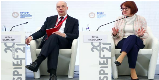
Russian Finance Minister Anton Siluanov and Central Bank Governor Elvira Nabiullina at the St. Petersburg International Economic Forum (SPIEF).