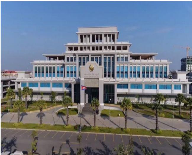
ប្រភព៖ Phnom Penh Post ២០២១ រូបភាព៖ NBC

ធនាគារជាតិនៃកម្ពុជា (NBC) បានដាក់ចេញនូវវិធានការដោះស្រាយបំណុលដំណាក់កាលទី៣ ក្នុងគោលបំណងផ្តល់ឱ្យស្ថាប័នហិរញ្ញវត្ថុ (FI) នូវការជំរុញបន្ថែមដែលអាចឱ្យពួកគេដាក់ប្រាក់កម្ចីបន្ថែមទៀត ដើម្បីជំរុញសកម្មភាពសេដ្ឋកិច្ច ខណៈដែលកម្ពុជាកំពុងខិតខំដើម្បីធ្វើឱ្យប្រសើរឡើងវិញ ដោយសារការផ្ទុះរីករាលដាលក្នុងសហគមន៍ នៃមេរោគកូវីដ-១៩ នាព្រឹត្តិការណ៍២០ កុម្ភៈ។