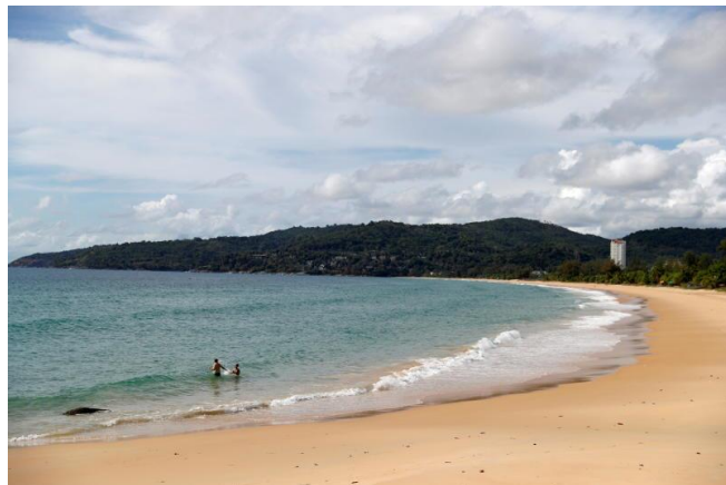
ប្រភព៖ Bangkok Post, 2021 រូបភាព៖ Reuter file photo

ការធ្លាក់ចុះនៃសេដ្ឋកិច្ចប្រទេសថៃ នៅក្នុងត្រីមាសទី១ មានការធូរស្រាល ប៉ុន្តែទស្សនវិស័យមួយចំនួនត្រូវបាន កាត់បន្ថយ ខណៈជំងឺកូវីដ-១៩ នៅតែអូសបន្លាយ